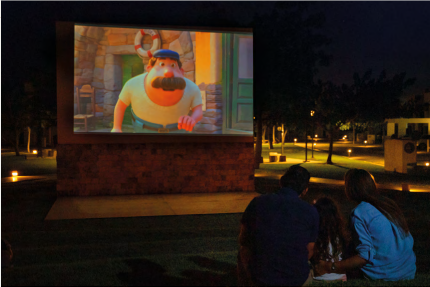
CINE AL AIRE LIBRE