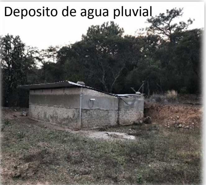
Deposito de agua pluvial