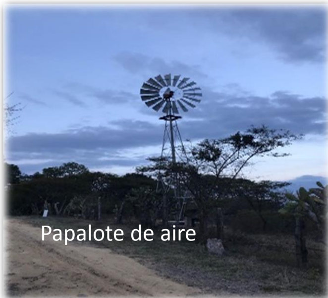
Papalote de aire