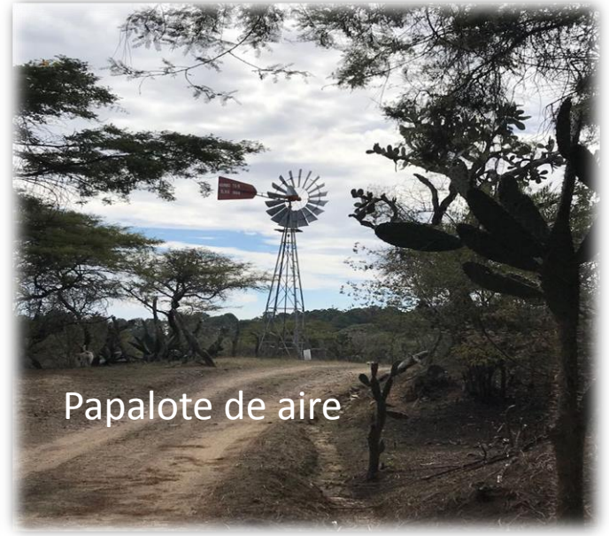
Papalote de aire