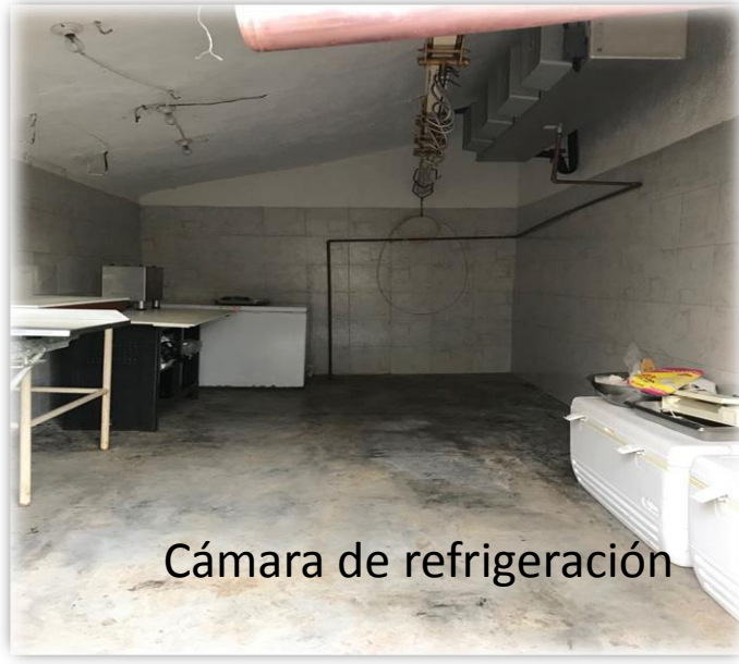
Cámara de refrigeración