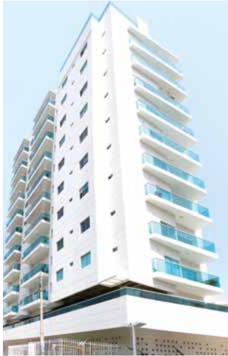
Casa Duque Apartamentos Manga (2015)