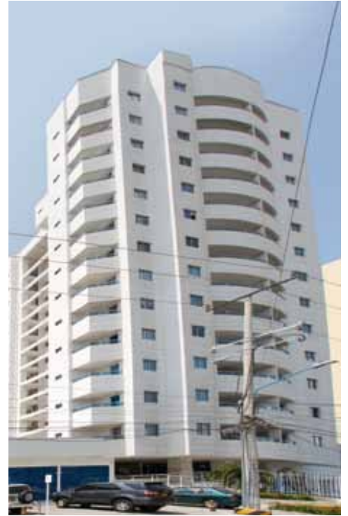
Antonella Apartamentos Manga (2013)