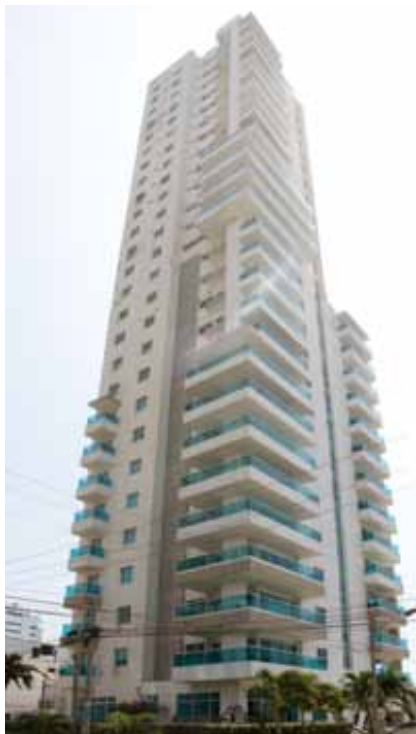
Portobelo Apartamentos Castillogrande (2009)