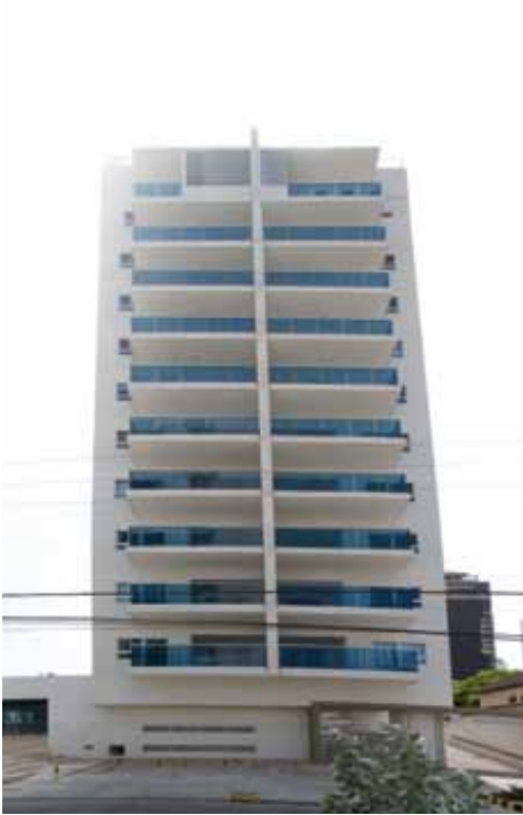
Palma Soriana Apartamentos Manga (2015)