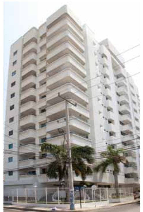
Bemaral Apartamentos Manga (2008)