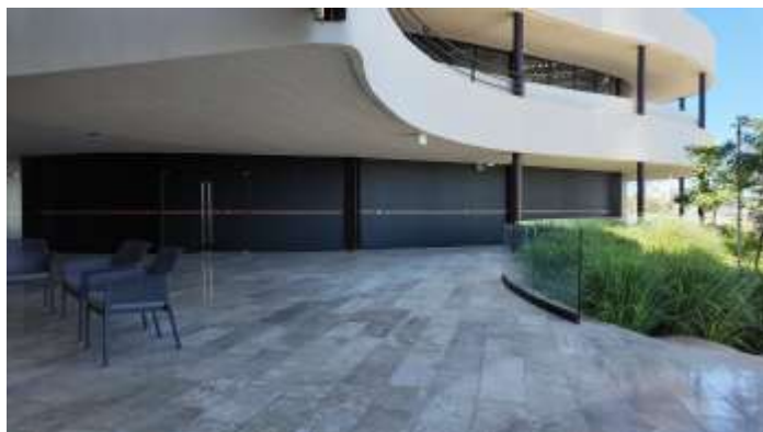
UBICACIÓN EN EL N1: