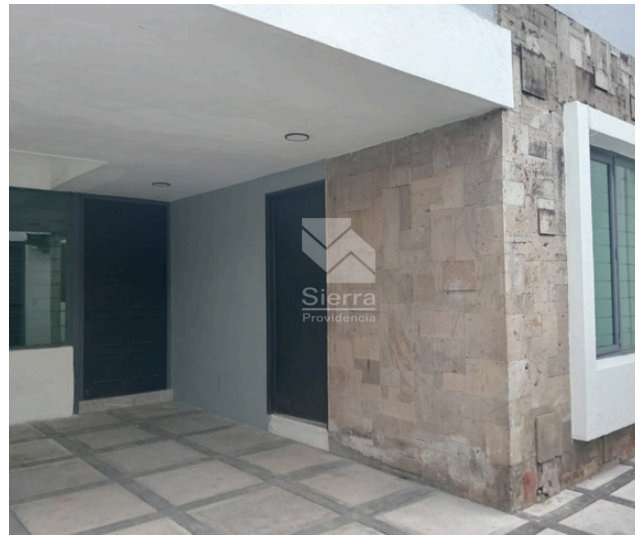
INGRESO - COCHERA