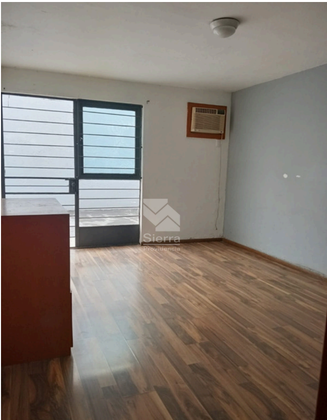
RECÁMARA PRINCIPAL CON CLOSET