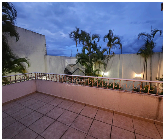
BALCÓN RECÁMARA PRINCIPAL