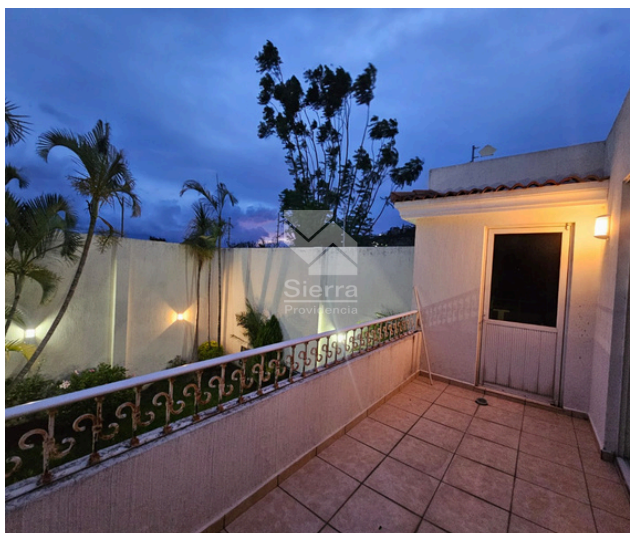
BALCÓN RECÁMARA PRINCIPAL