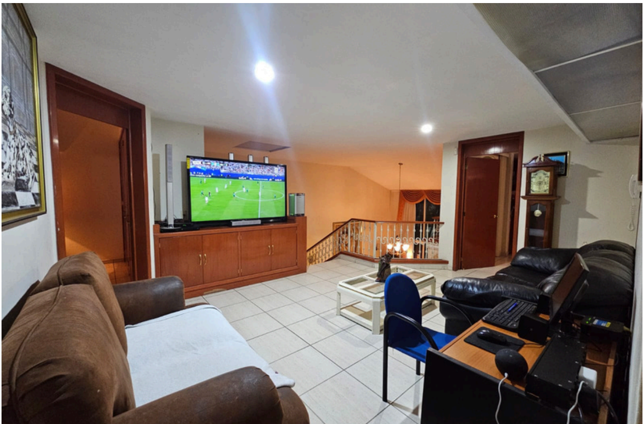
DISTRIBUCIÓN SEGUNDO NIVEL