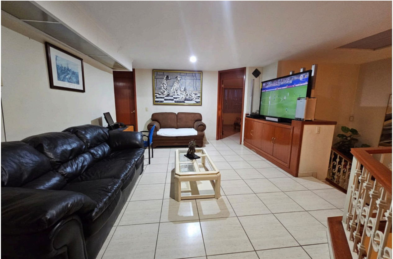
ESTAR DE TV