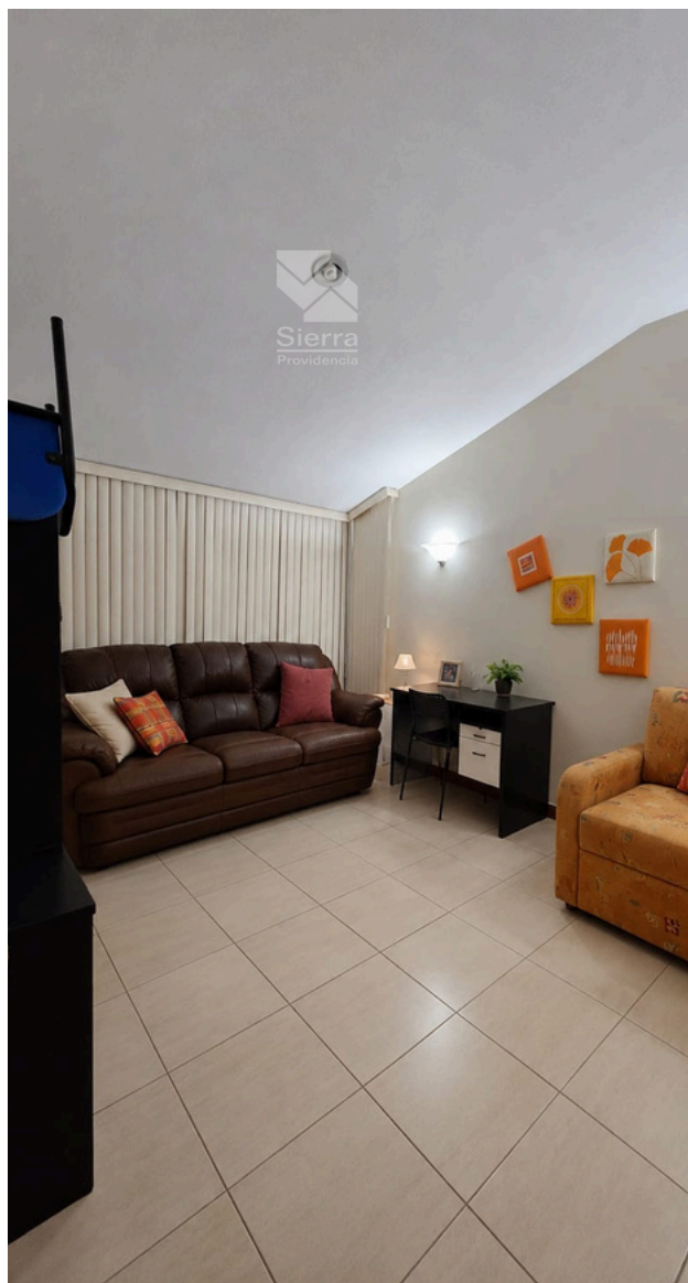
RECÁMARA SECUNDARIA 3