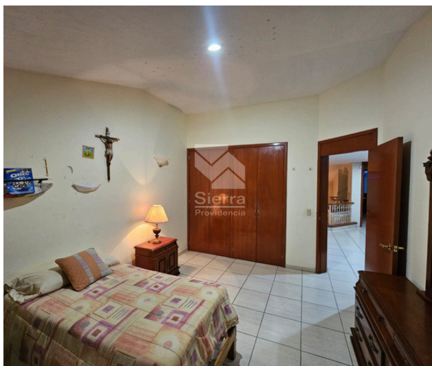
RECÁMARA SECUNDARIA 2