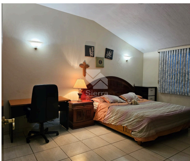
RECÁMARA SECUNDARIA 1