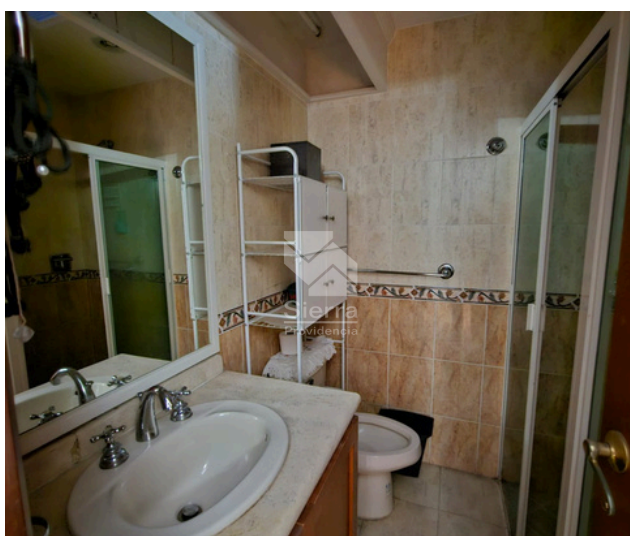
BAÑO COMPLETO COMPARTIDO