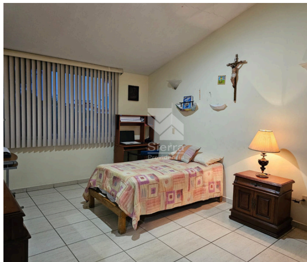
RECÁMARA SECUNDARIA 2