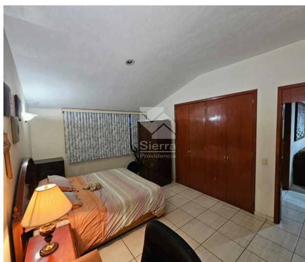
RECÁMARA SECUNDARIA 1