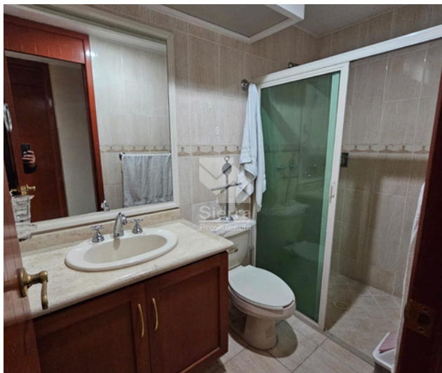
BAÑO RECÁMARA SECUNDARIA 1