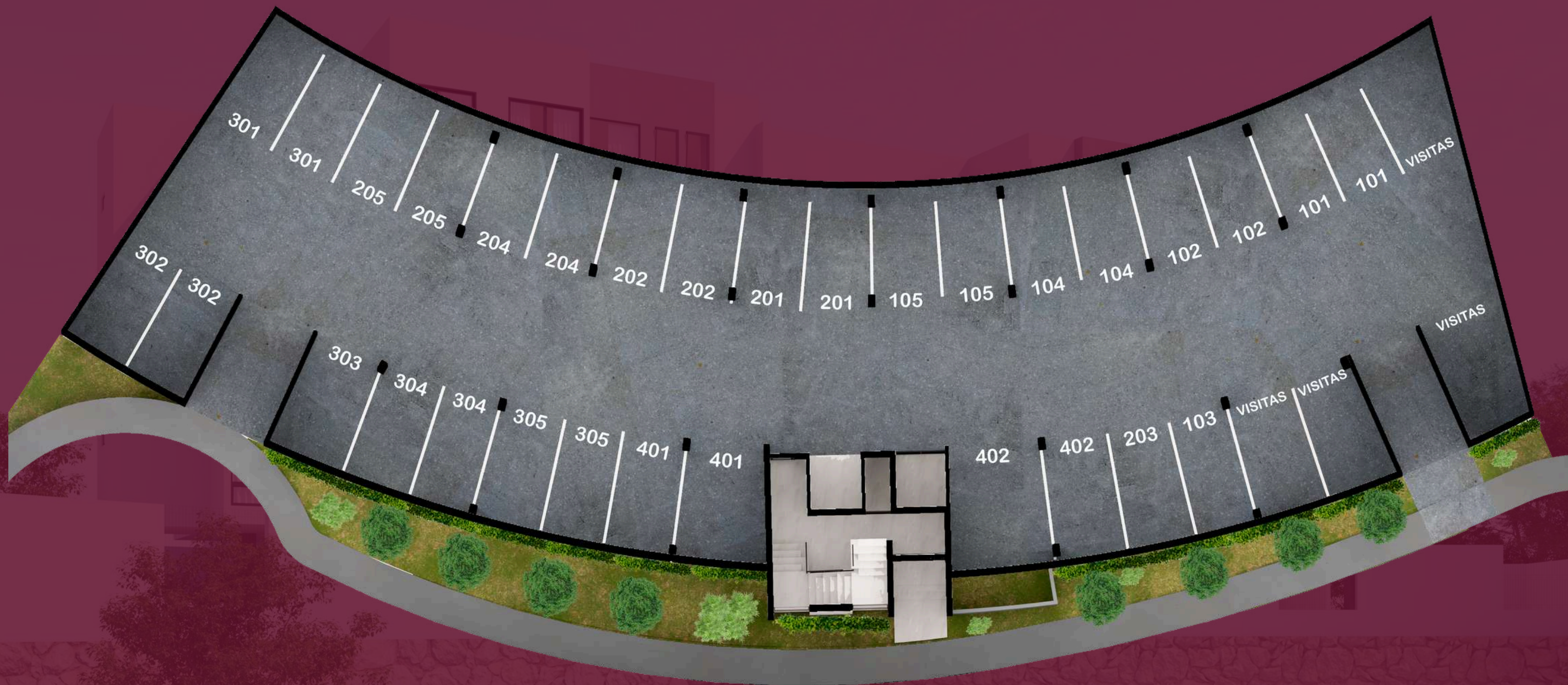
ZONA DE ESTACIONAMIENTO PRIVADA