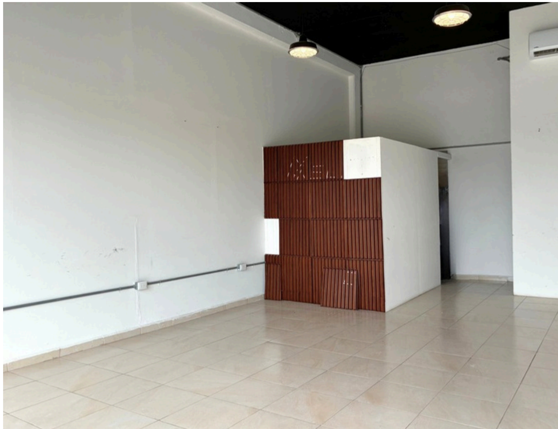
Interior del local