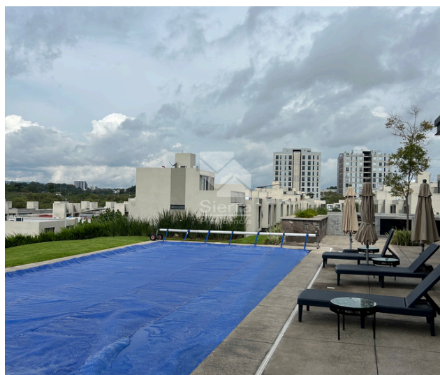
CASA CLUB Y ALBERCA