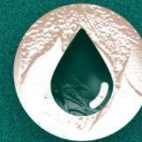
Acceso a agua potable