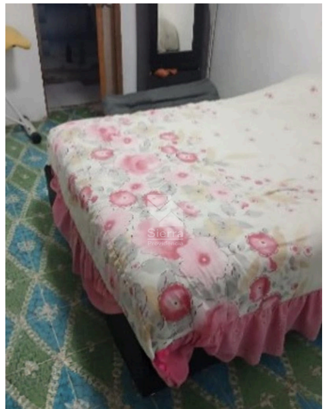
RECÁMARA PB 1