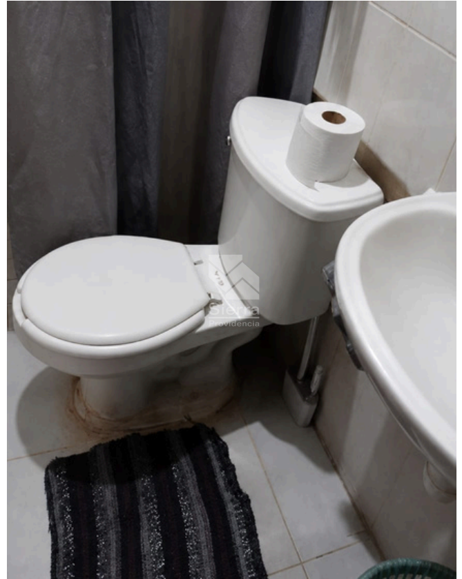
BAÑO COMPLETO 1