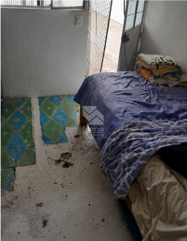
RECÁMARA PB 2