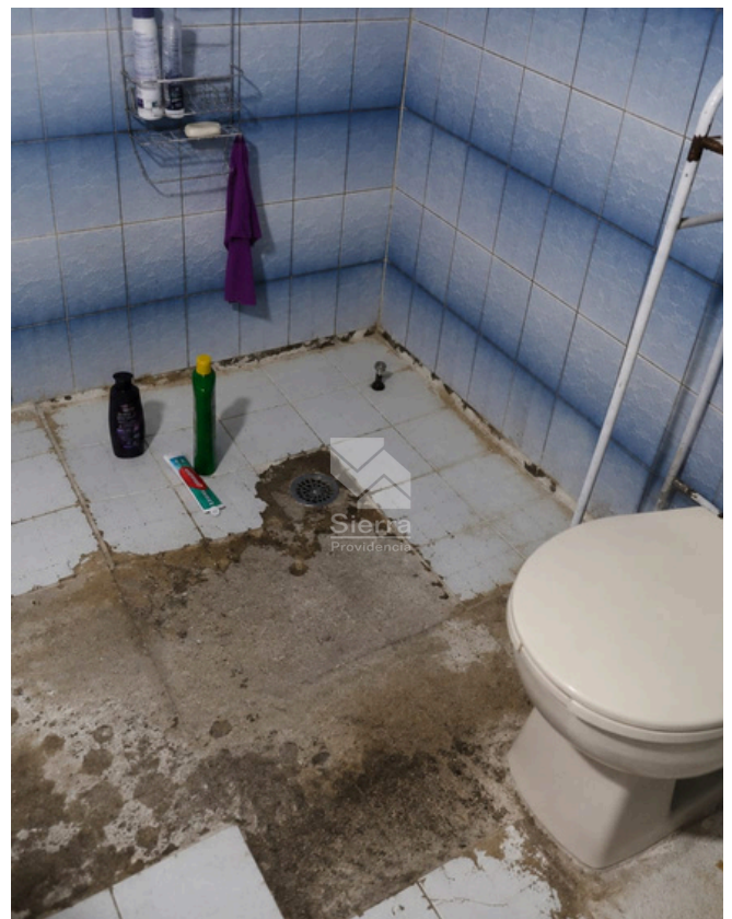
BAÑO COMPLETO PA