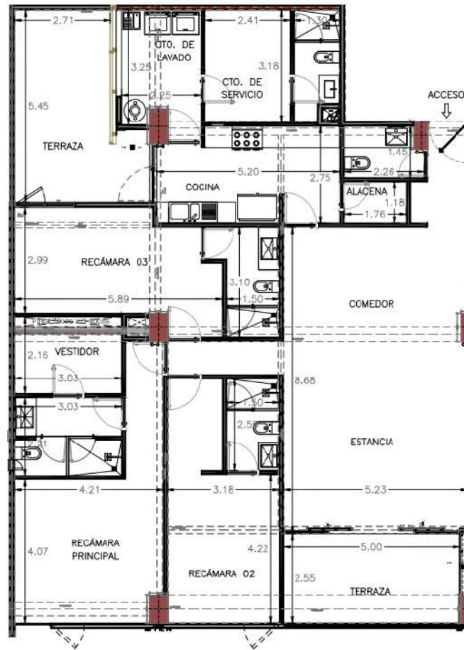
TIPO NIVEL 01