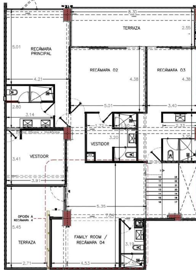
Planta Alta ESC: 1:150