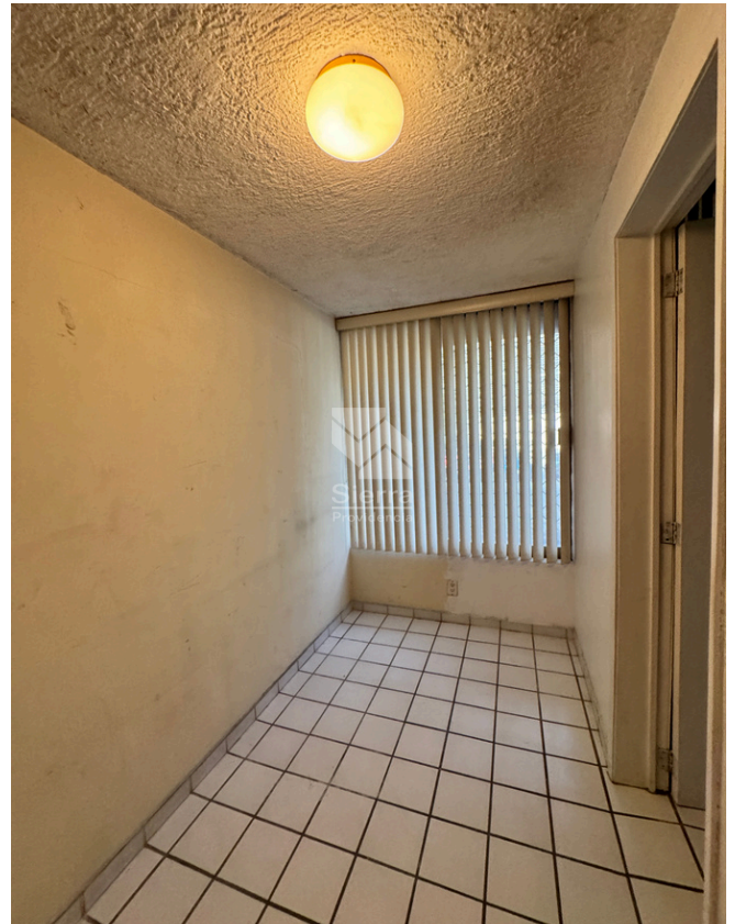
CUARTO DE SERVICIO