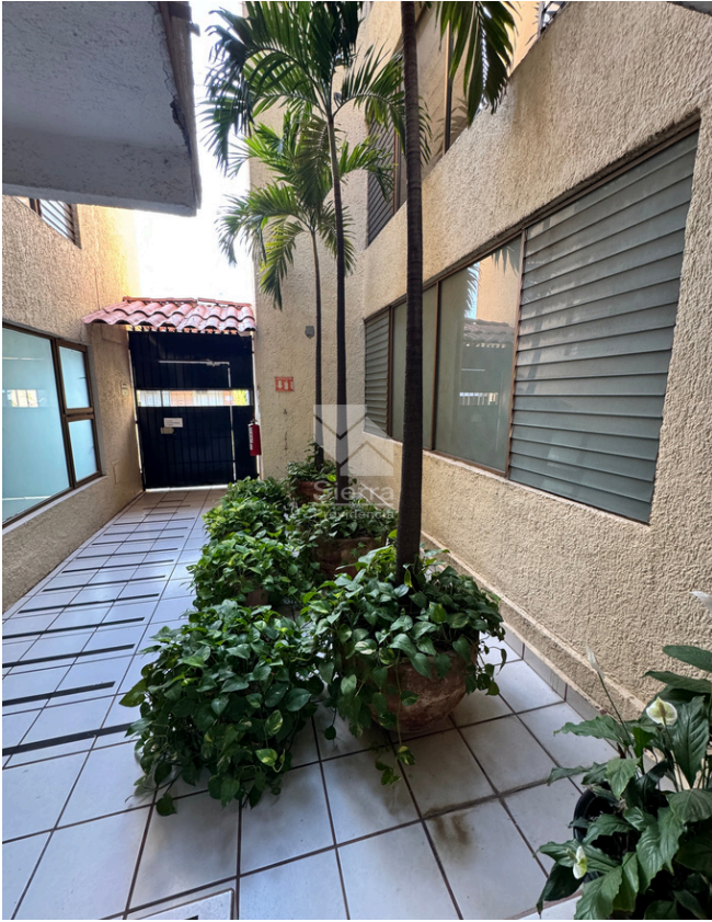
INGRESO A TORRE