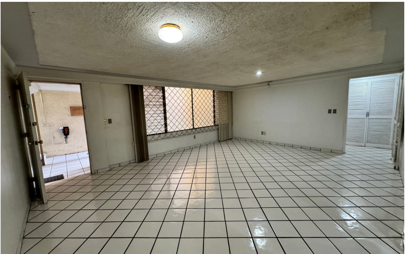
INGRESO A DEPARTAMENTO