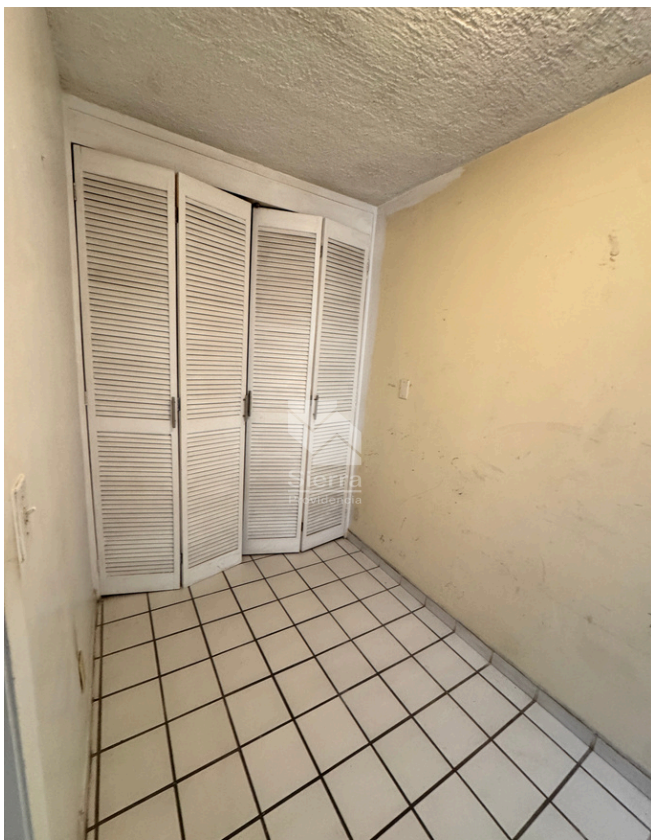
CUARTO DE SERVICIO