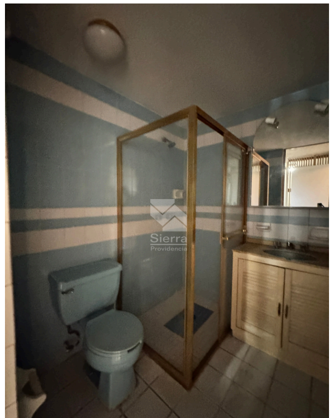
BAÑO CUARTO DE SERVICIO