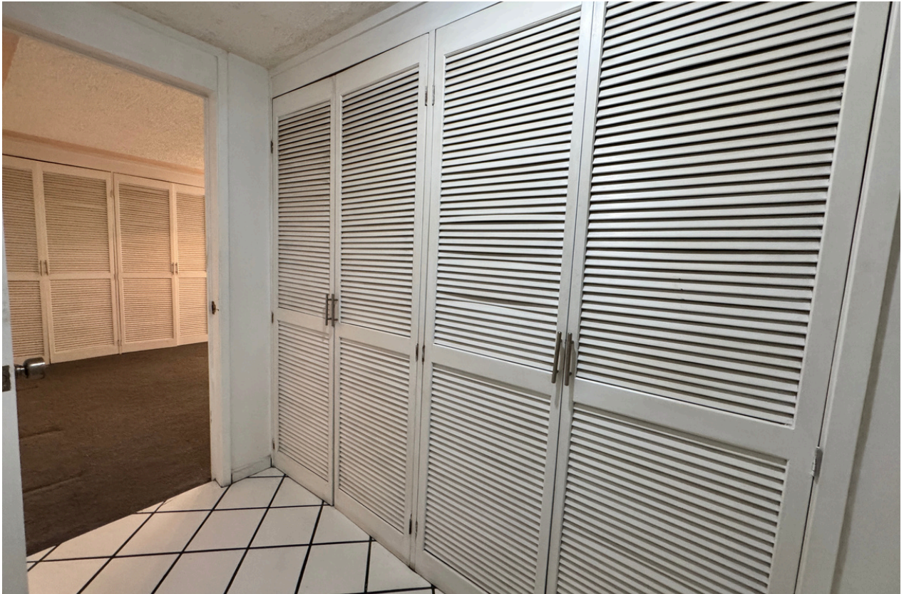
CLÓSET DE BLANCOS