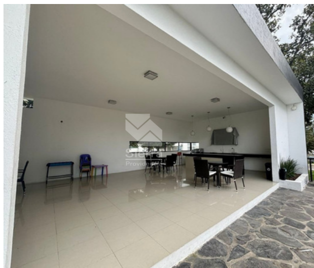
TERRAZA DE USOS MÚLTIPLES