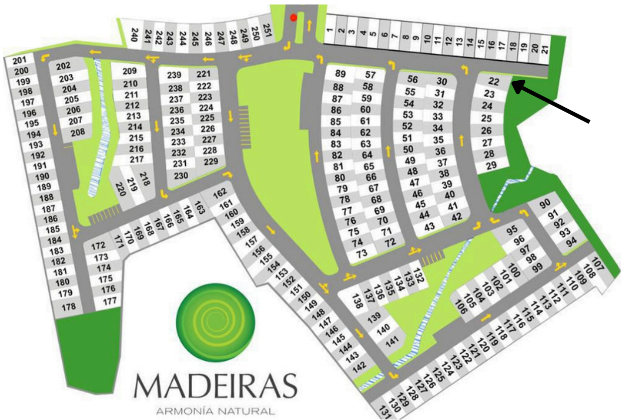
MAPA DE FRACCIONAMIENTO