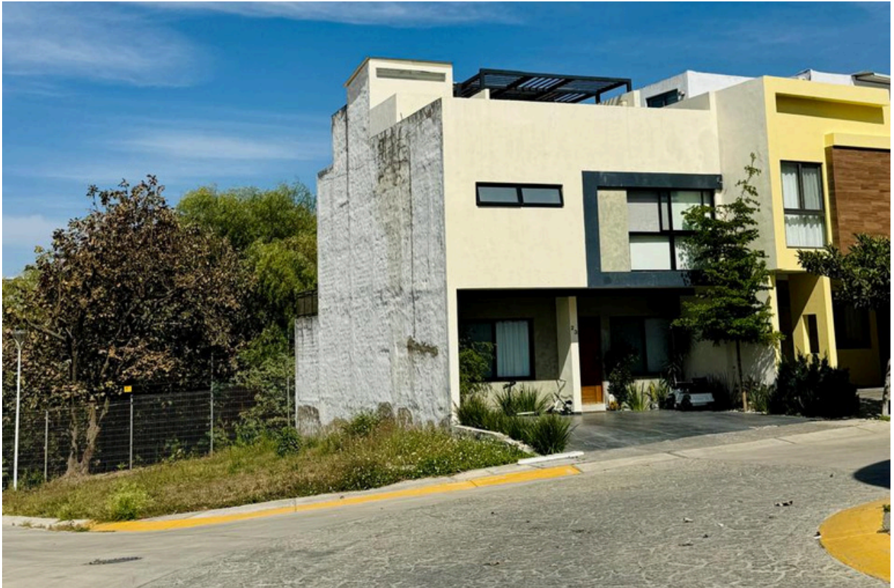
VISTA DESDE CALLE