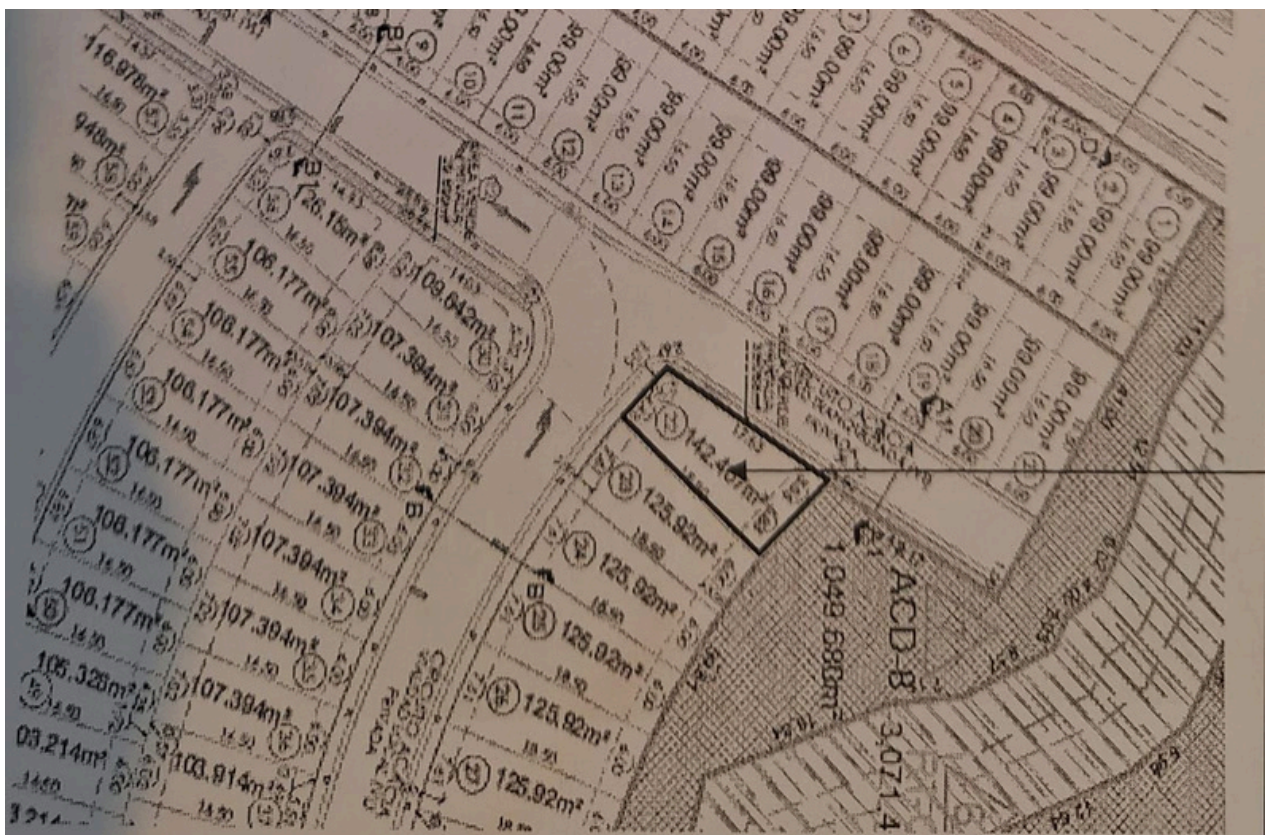
MAPA DE LOTE L22