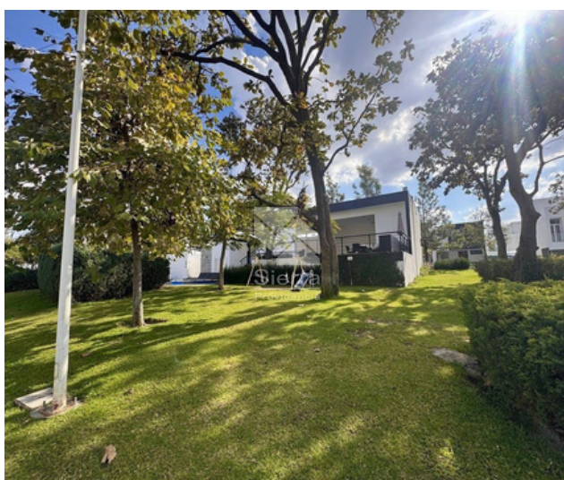
ÁREA VERDE Y JUEGOS INFANTILES