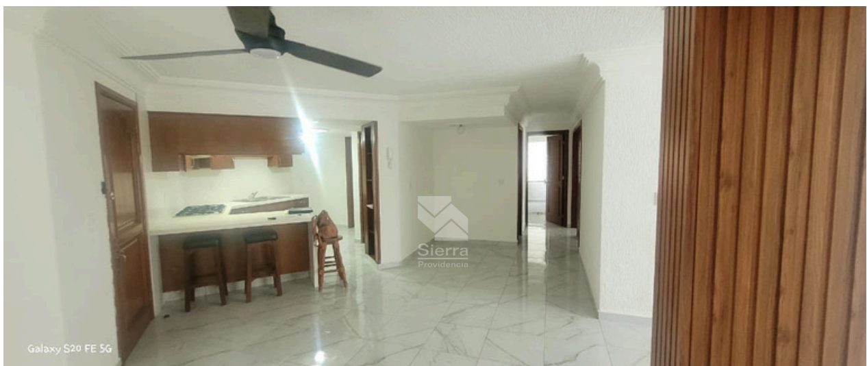
COMEDOR - BARRA