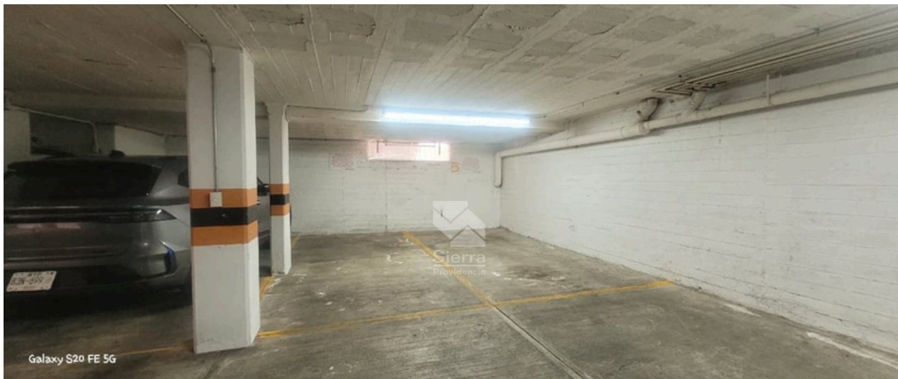
ESTACIONAMIENTO PARA 2 AUTOS