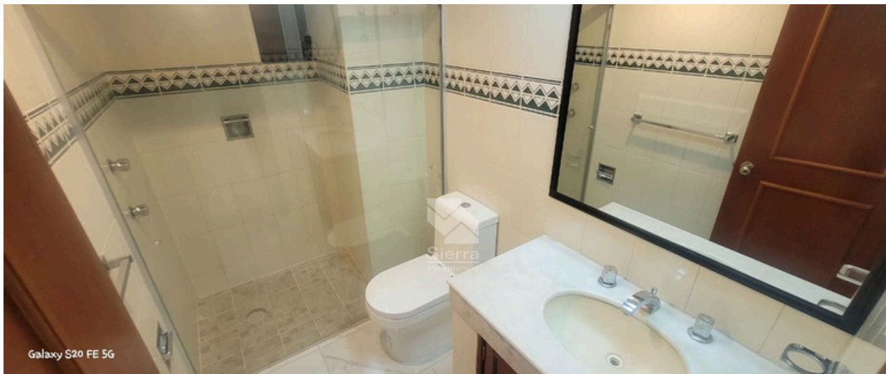
BAÑO COMPLETO RECÁMARA PRINCIPAL