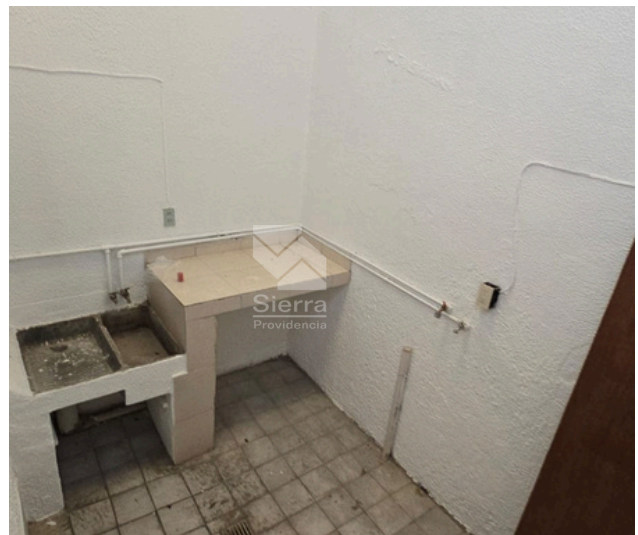
AREA DE LAVADO