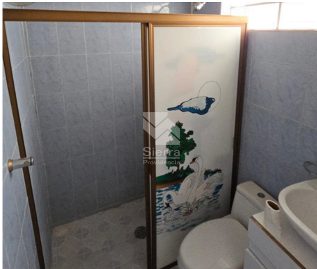
BAÑO COMPLETO PA