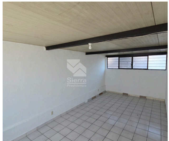
RECÁMARA PB 2