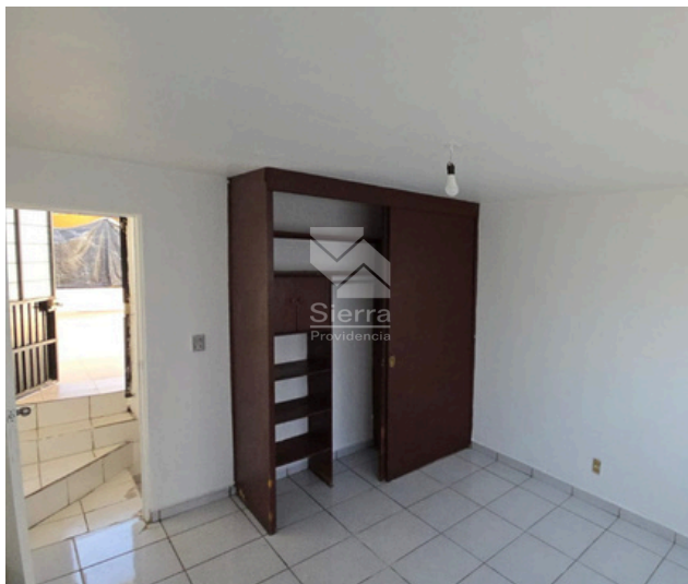
RECÁMARA PB 1