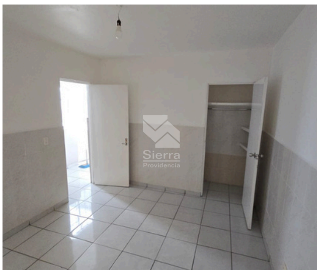
RACÁMARA PA 1