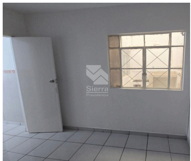
RACÁMARA PA 2