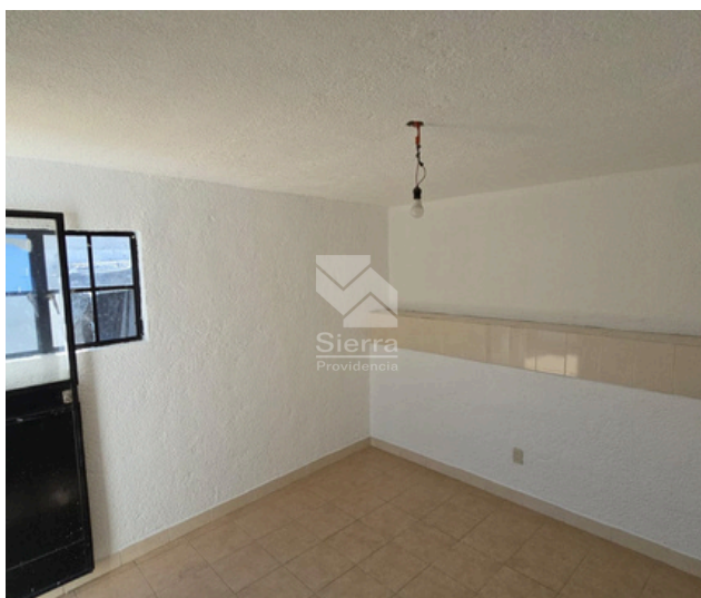
RECÁMARA PB 3