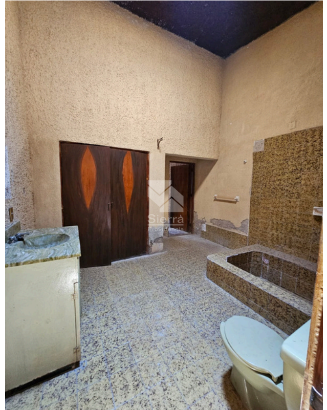
BAÑO COMPLETO CON TINA