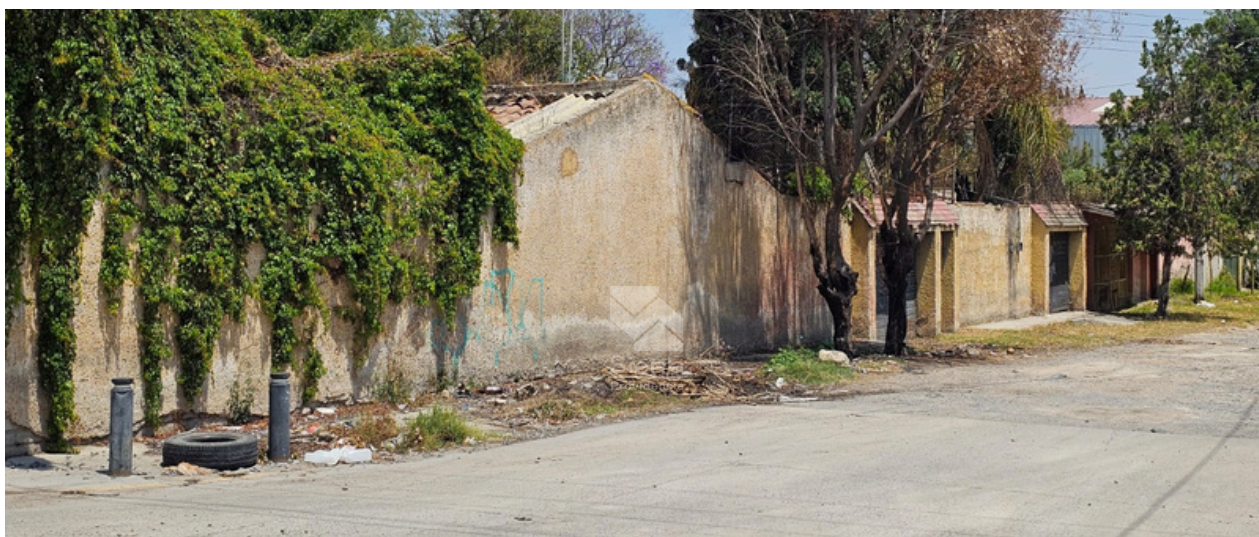
CALLE DE INGRESO