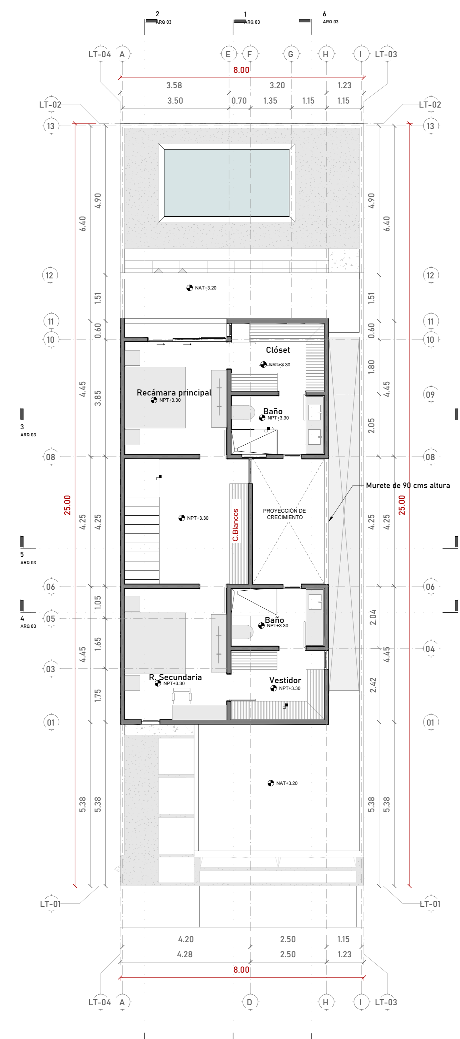
PLANTA ALTA ESC 1:100