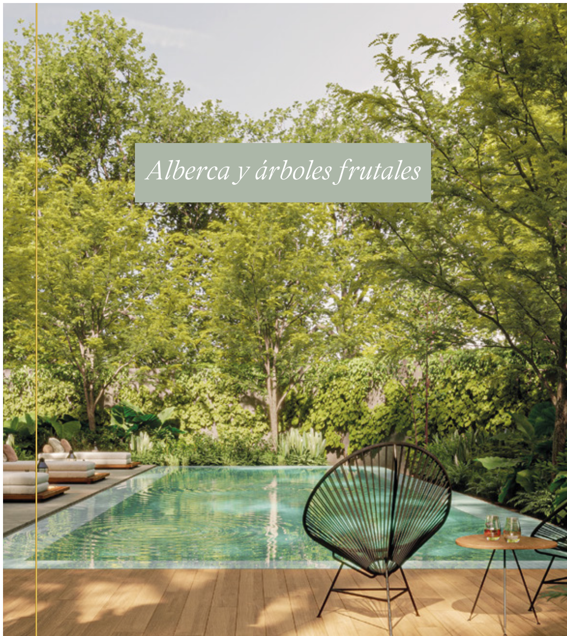
Alberca y árboles frutales