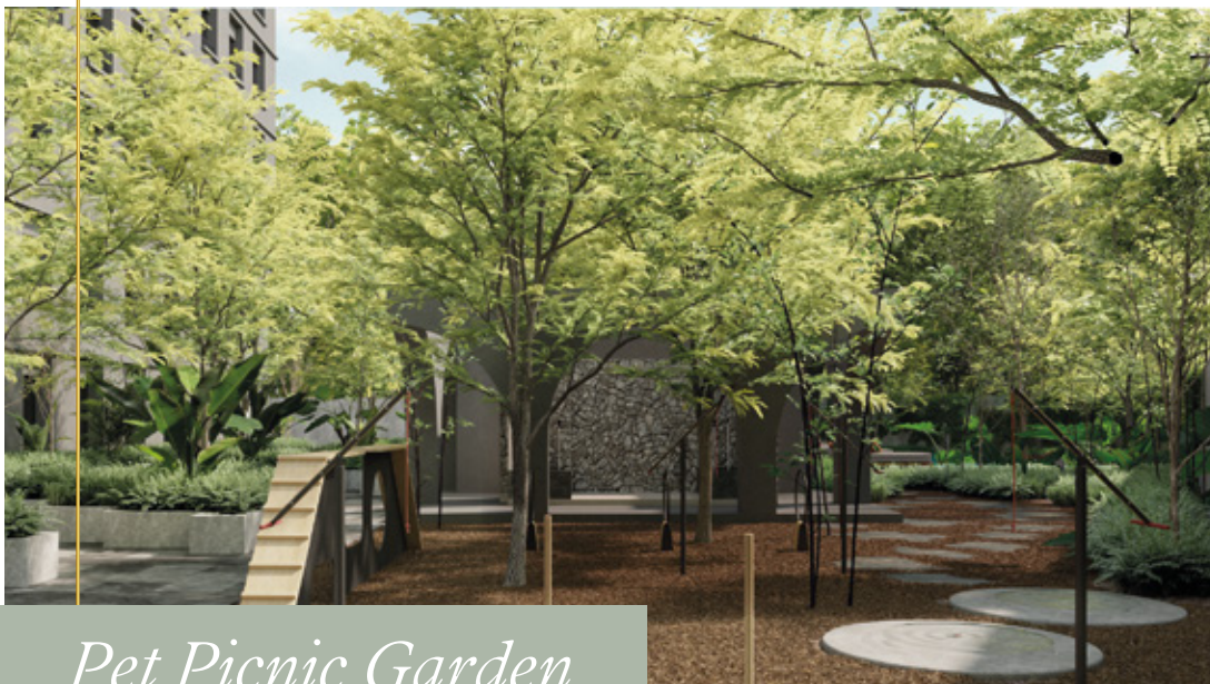
Pet Picnic Garden