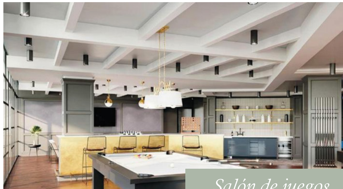
Salón de juegos