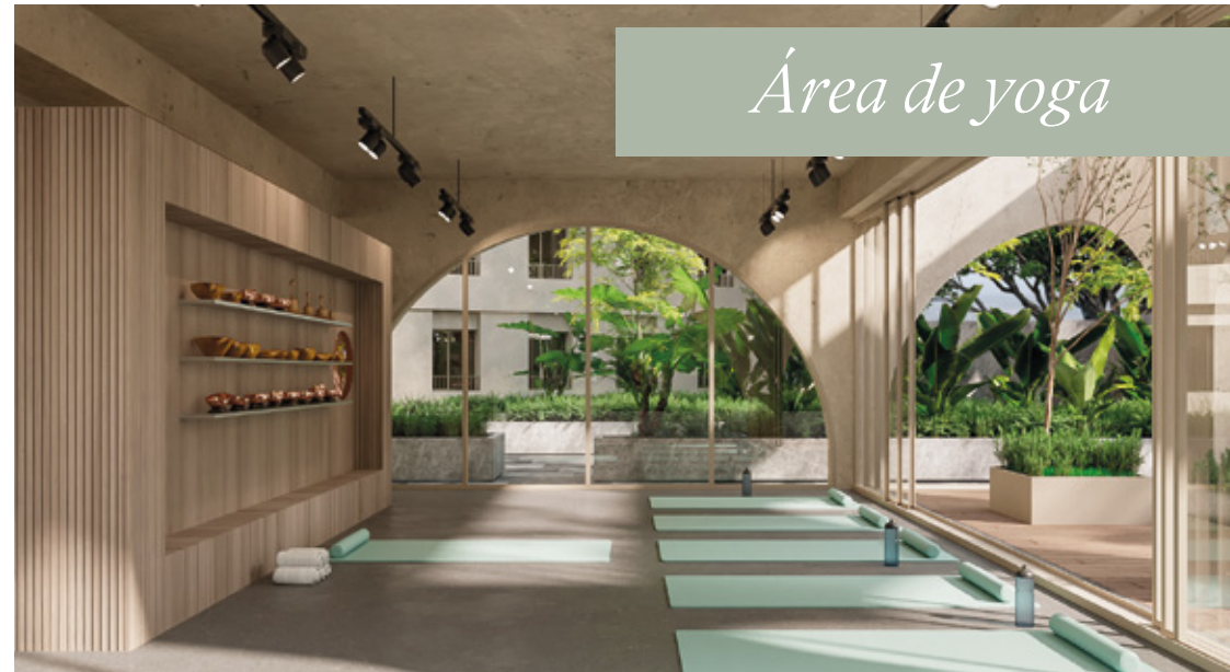
Área de yoga