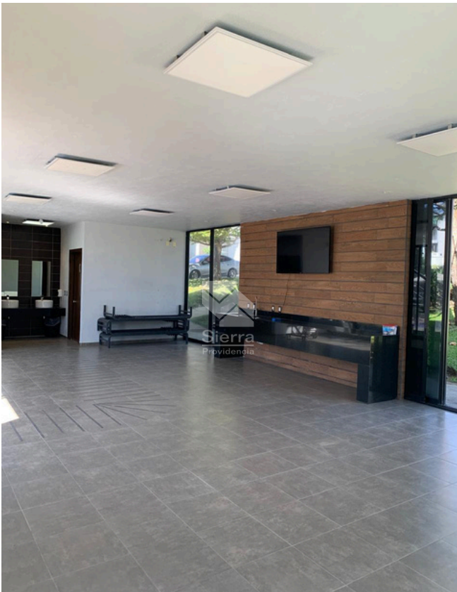
SALON DE EVENTOS