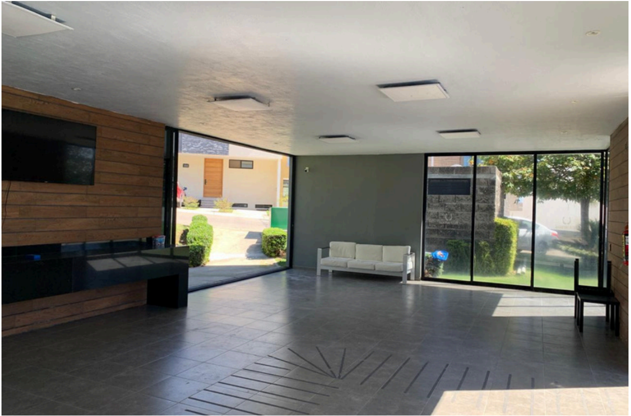
ÁREA DE EVENTOS