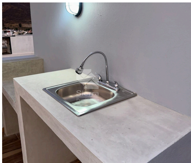
ROOF GARDEN CON ASADOR Y TARJA