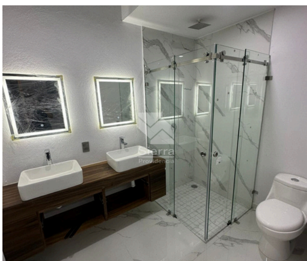
BAÑO COMPLETO COMPARTIDO