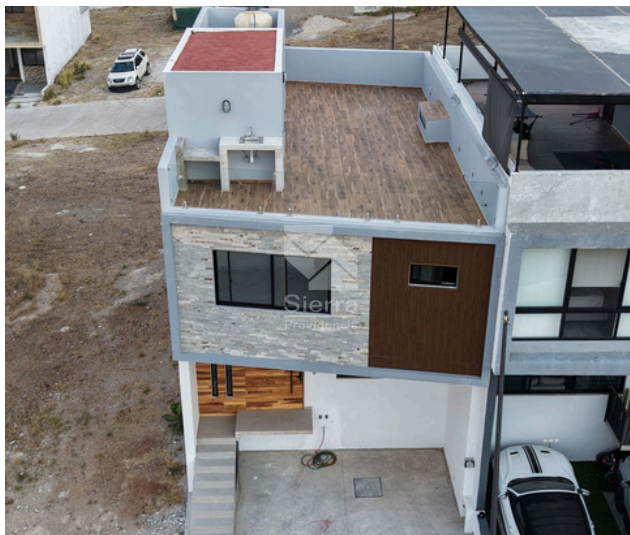
FACHADA TOMA AEREA