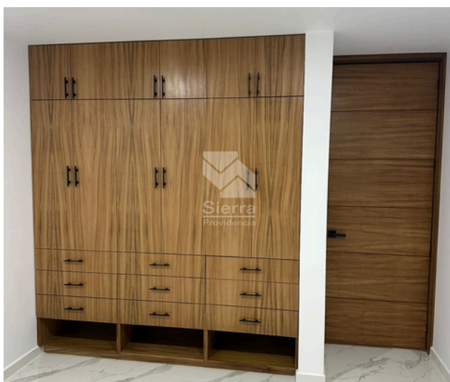
CLOSET RECÁMARA 2DA