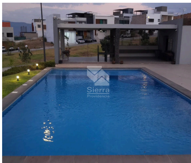
CASA CLUB CON ALBERCA