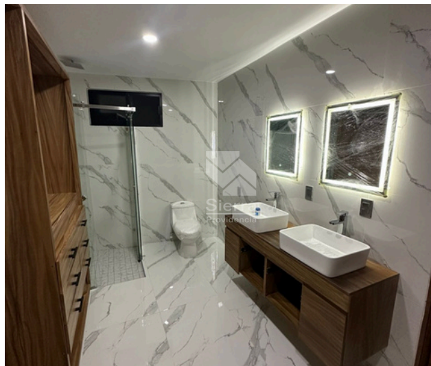
BAÑO COMPLETO / WALKING CLOSET