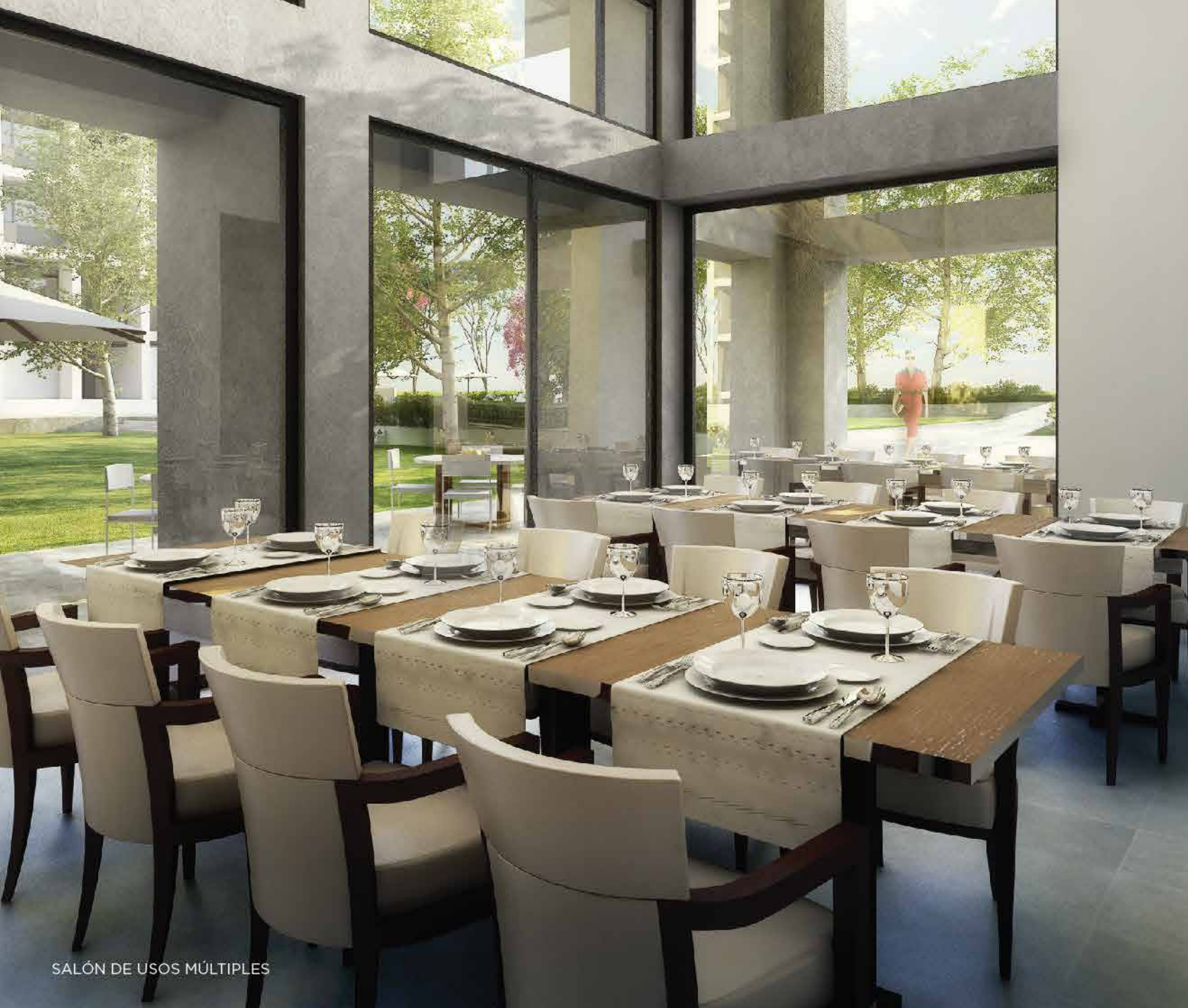
SALÓN DE USOS MÚLTIPLES