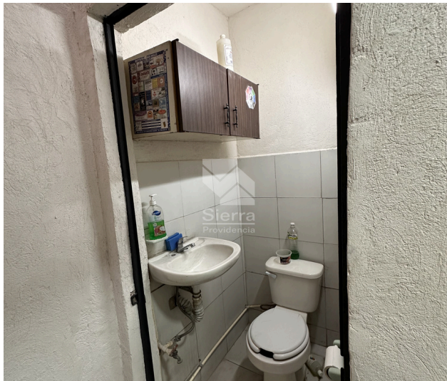
MEDIO BAÑO PLANTA BAJA