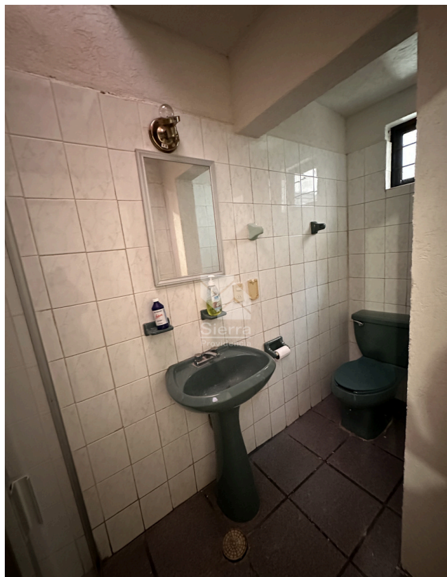
BAÑO SEGUNDO NIVEL