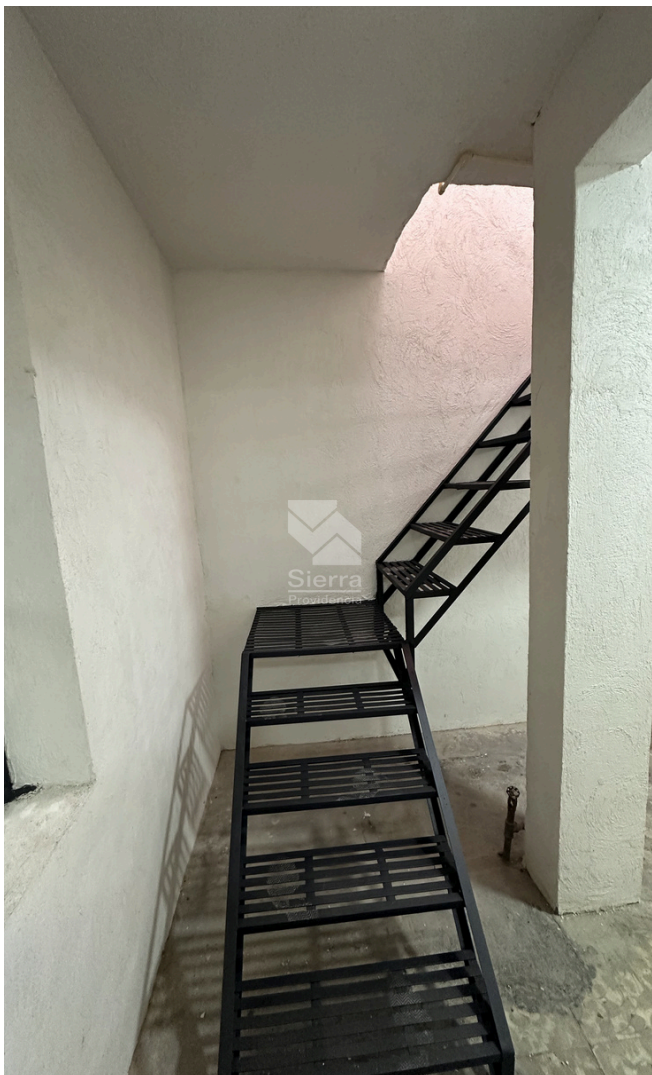
ESCALERAS A SEGUNDO NIVEL