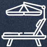
Área de Camastros