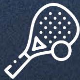
Cancha de Pádel