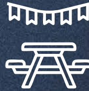
Salón de Fiestas al Aire Libre