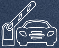
Caseta de Acceso