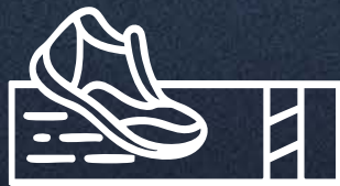
Pista de Jogging