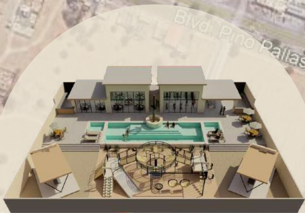
CASA CLUB CONVIVENCIA