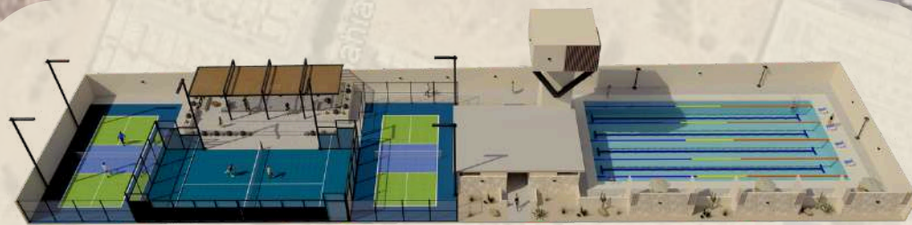
CASA CLUB DEPORTIVA