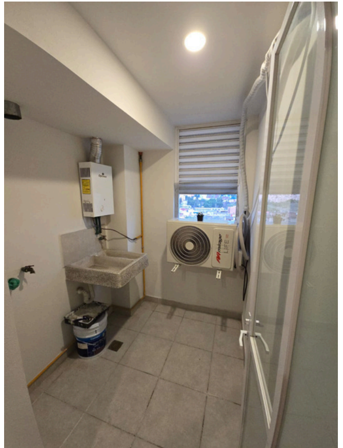
CUARTO DE LAVADO