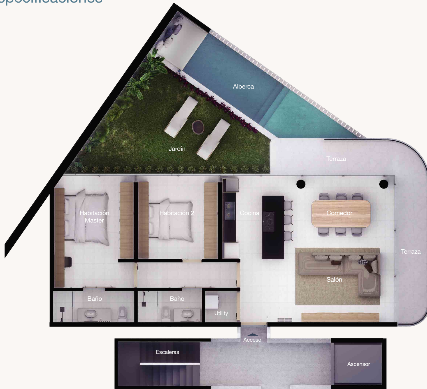
Nivel 1 Garden house