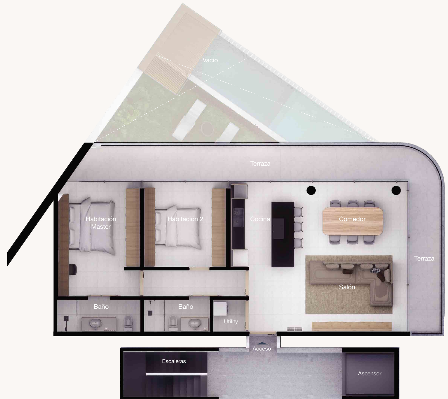
Nivel 2,3 y 4 Vivienda Tipo y Penthouse