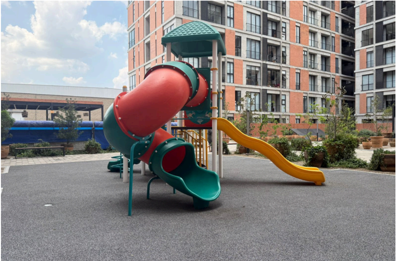
ÁREA DE JUEGOS INFANTILES