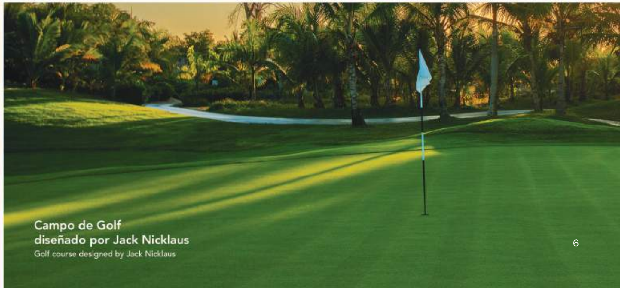
Campo de Golf diseñado por Jack Nicklaus Golf course designed by Jack Nicklaus