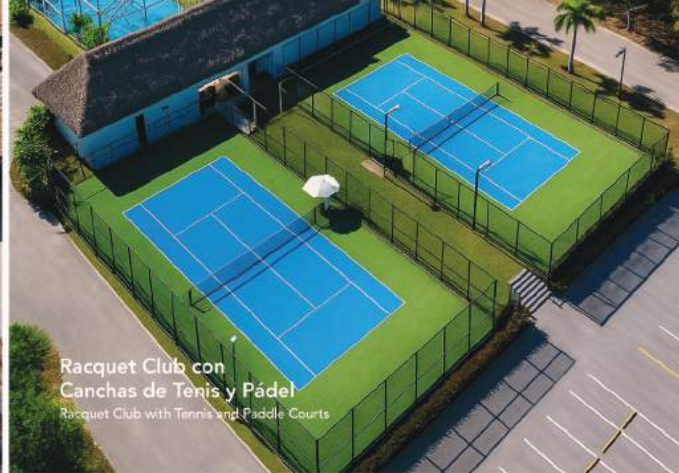
Racquet Club con Canchas de Tenis y Pádel Racquet Club with Tennis and Pádel Courts