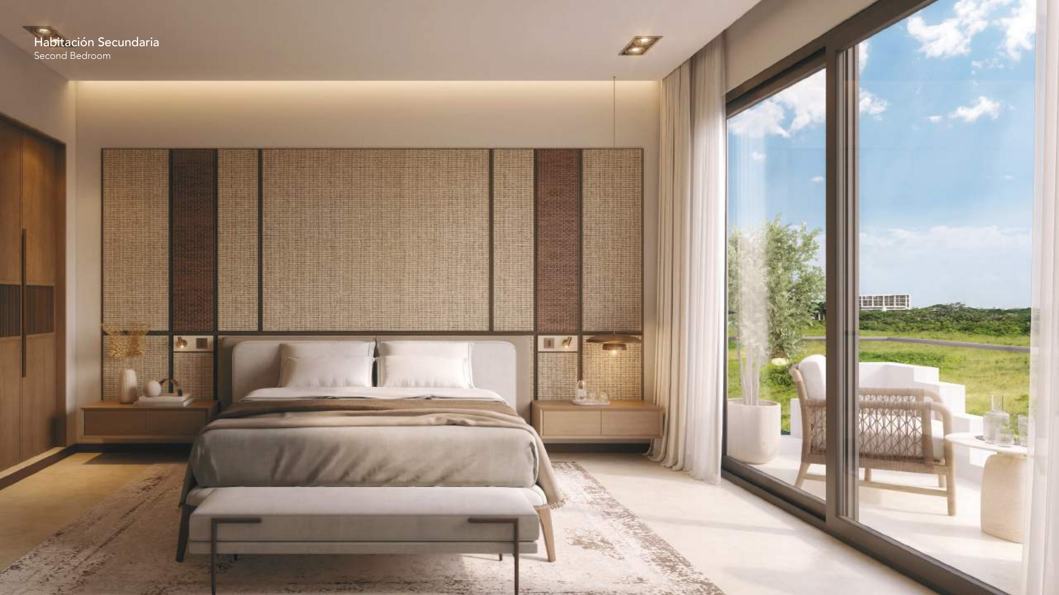
Habitación Secundaria Second Bedroom