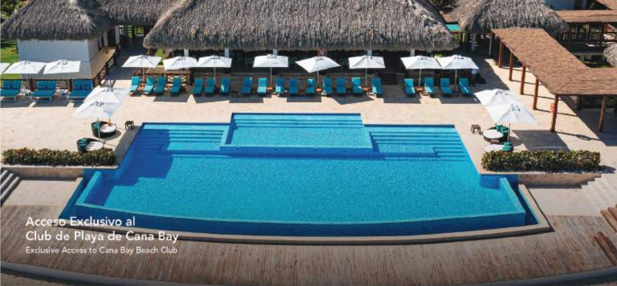
Acceso Exclusivo al Club de Playa de Cana Bay Exclusive Access to Cana Bay Beach Club