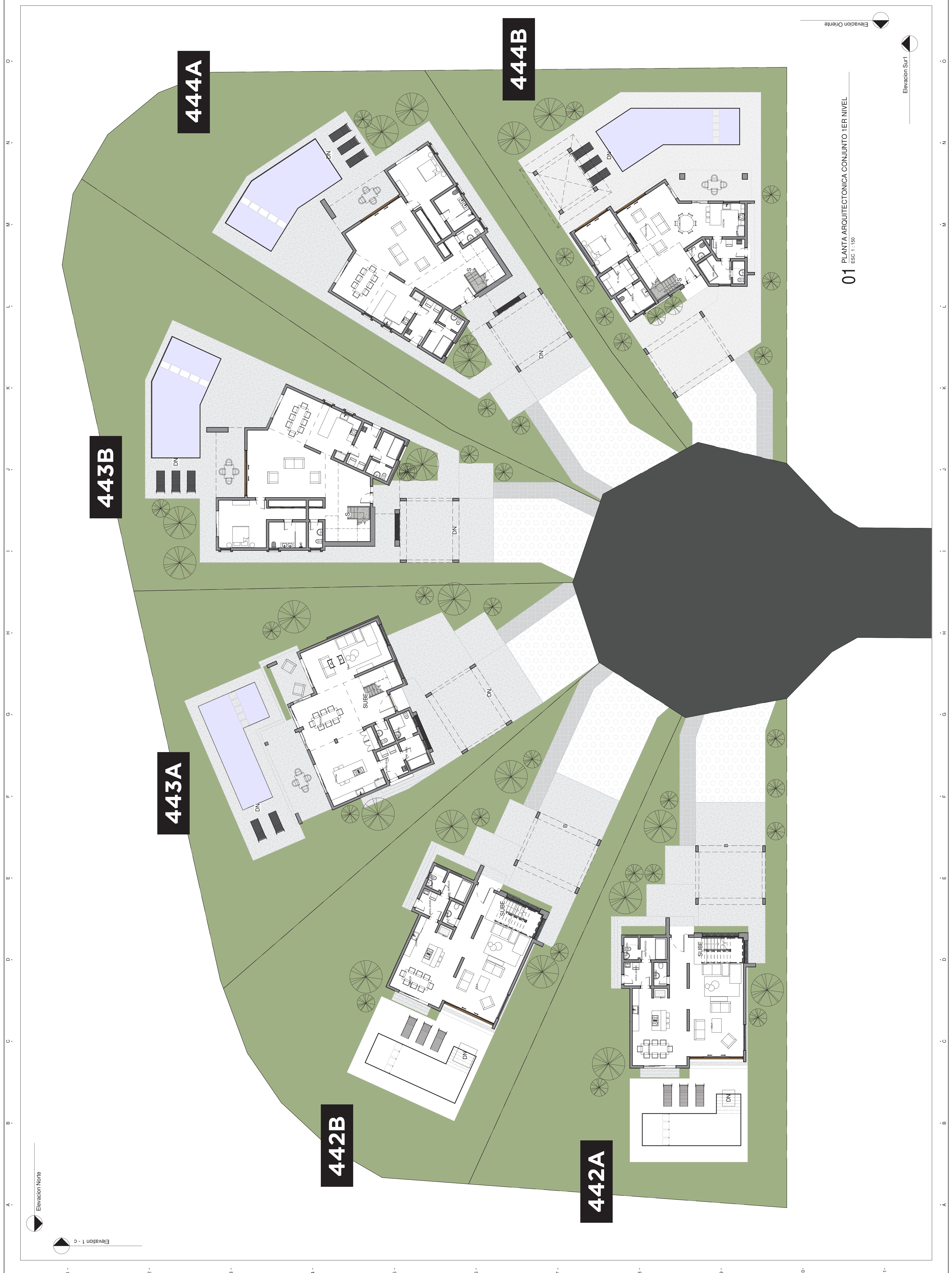
01 PLANTA ARQUITECTONICA CONJUNTO 1ER NIVEL ESC 1:150