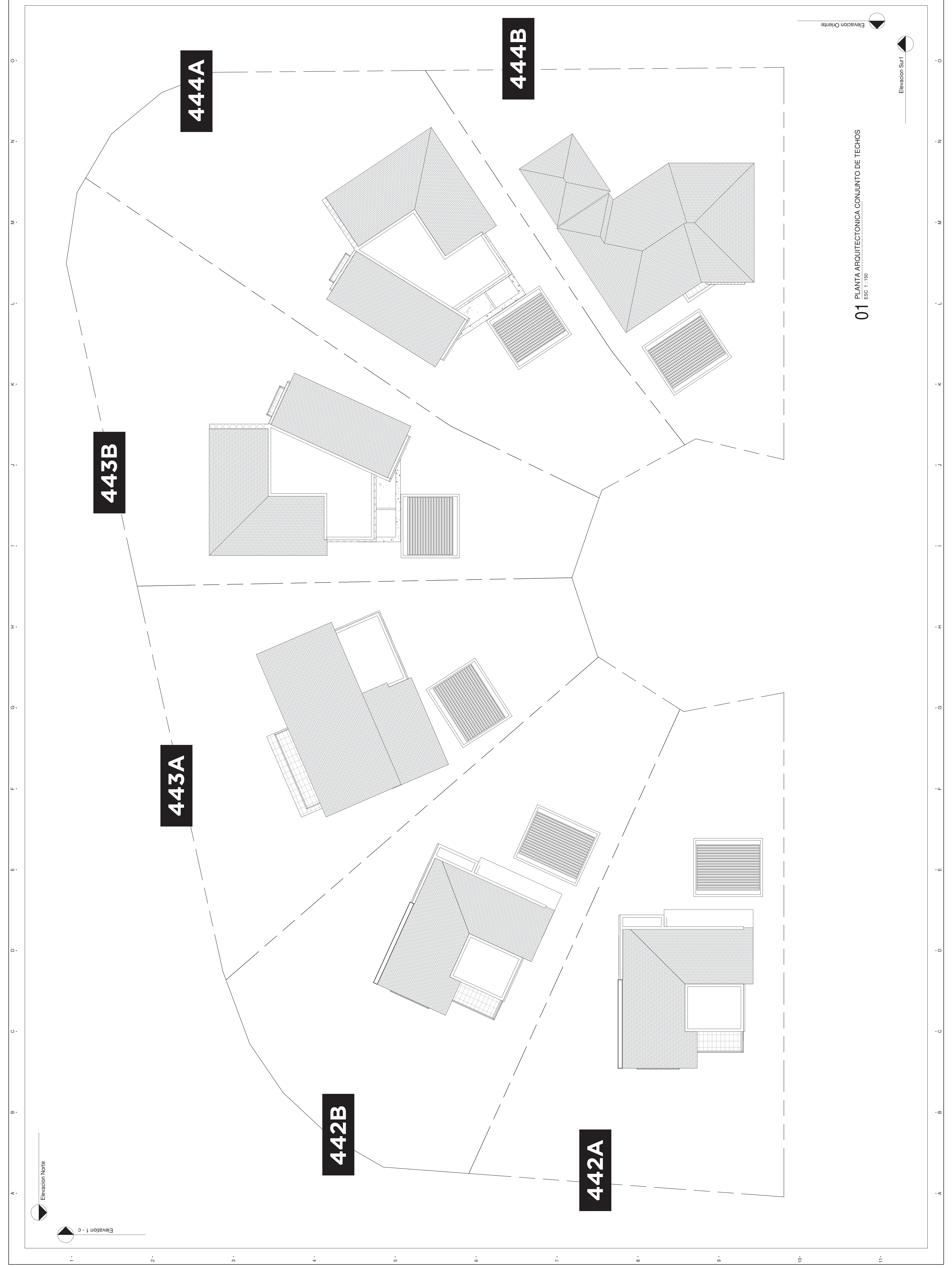
01 PLANTA ARQUITECTONICA CONJUNTO DE TECHOS ESC 1:150