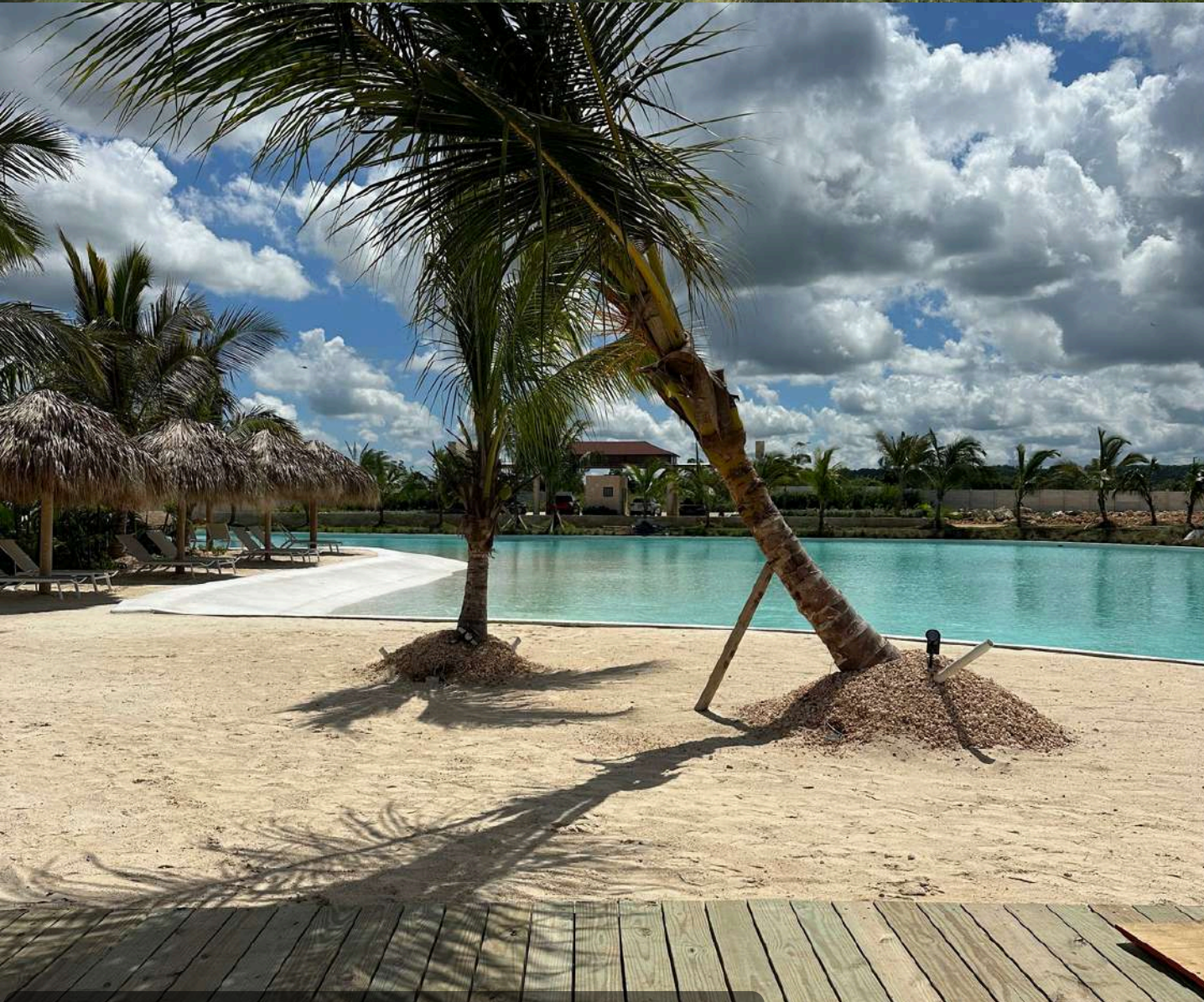
Casa Club y Playa Artificial Primavera Residences IV