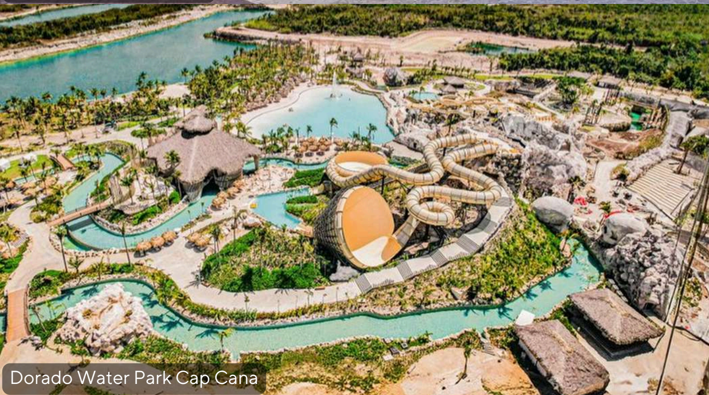
Dorado Water Park Cap Cana