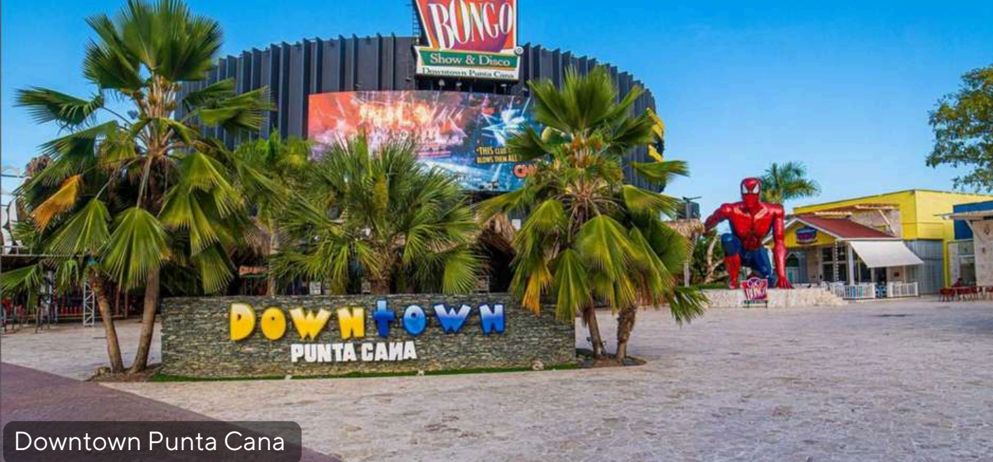
Downtown Punta Cana