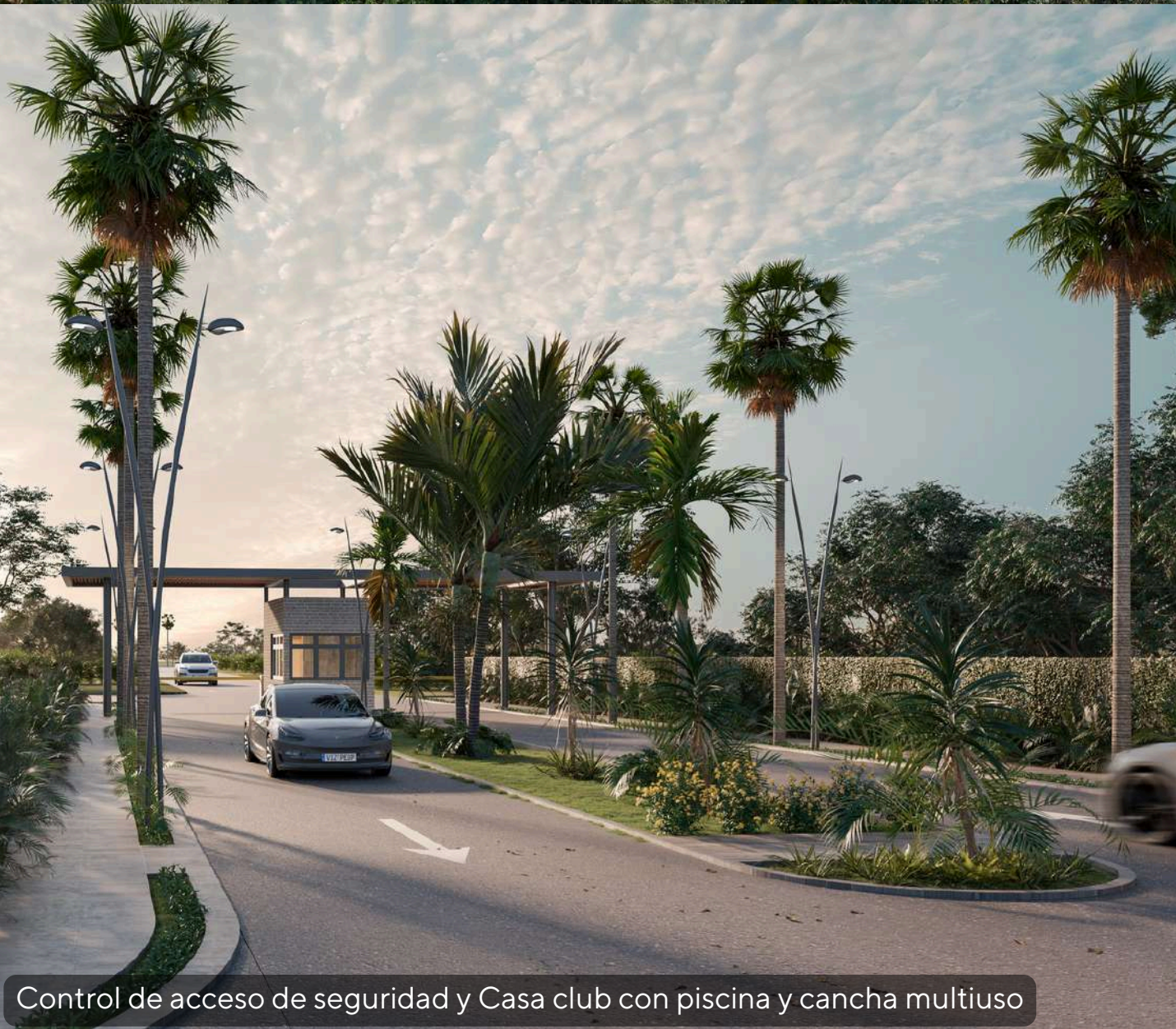
Control de acceso de seguridad y Casa club con piscina y cancha multiuso