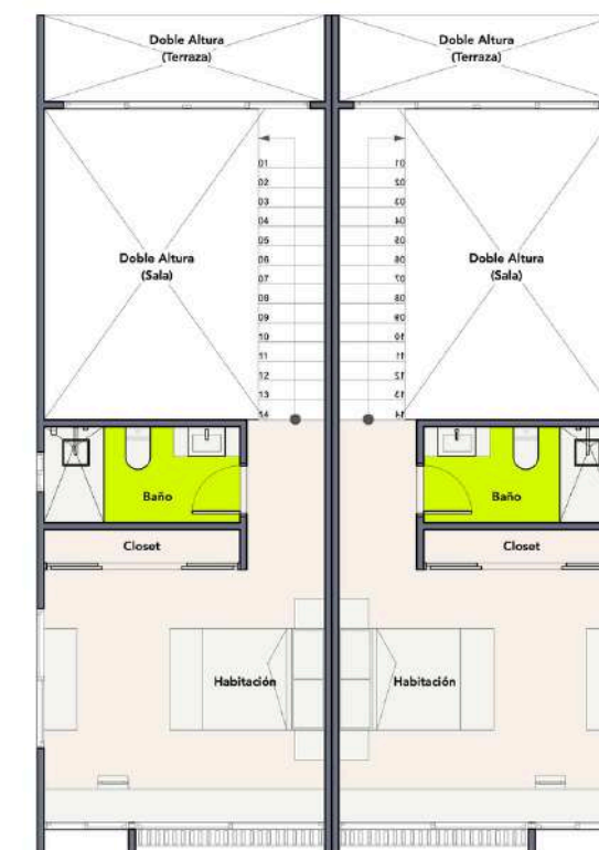
2do Nivel Planta 2D