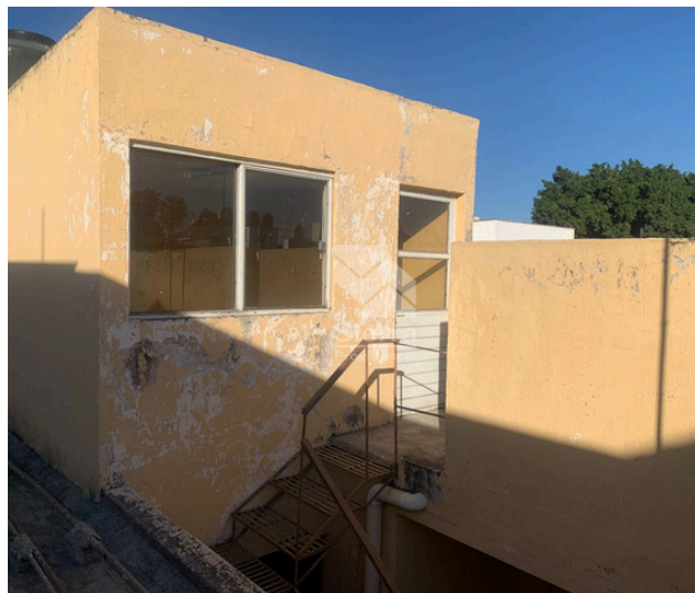
CUARTO SEGUNDO NIVEL