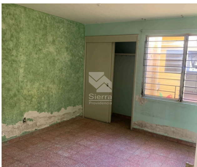
RECÁMARA SECUNDARIA 2