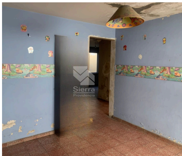
RECÁMARA SECUNDARIA 1