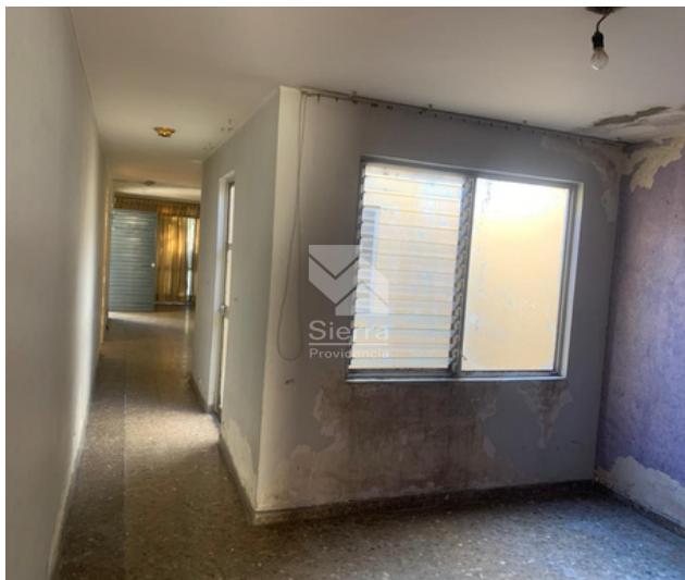
ESTAR DE TV