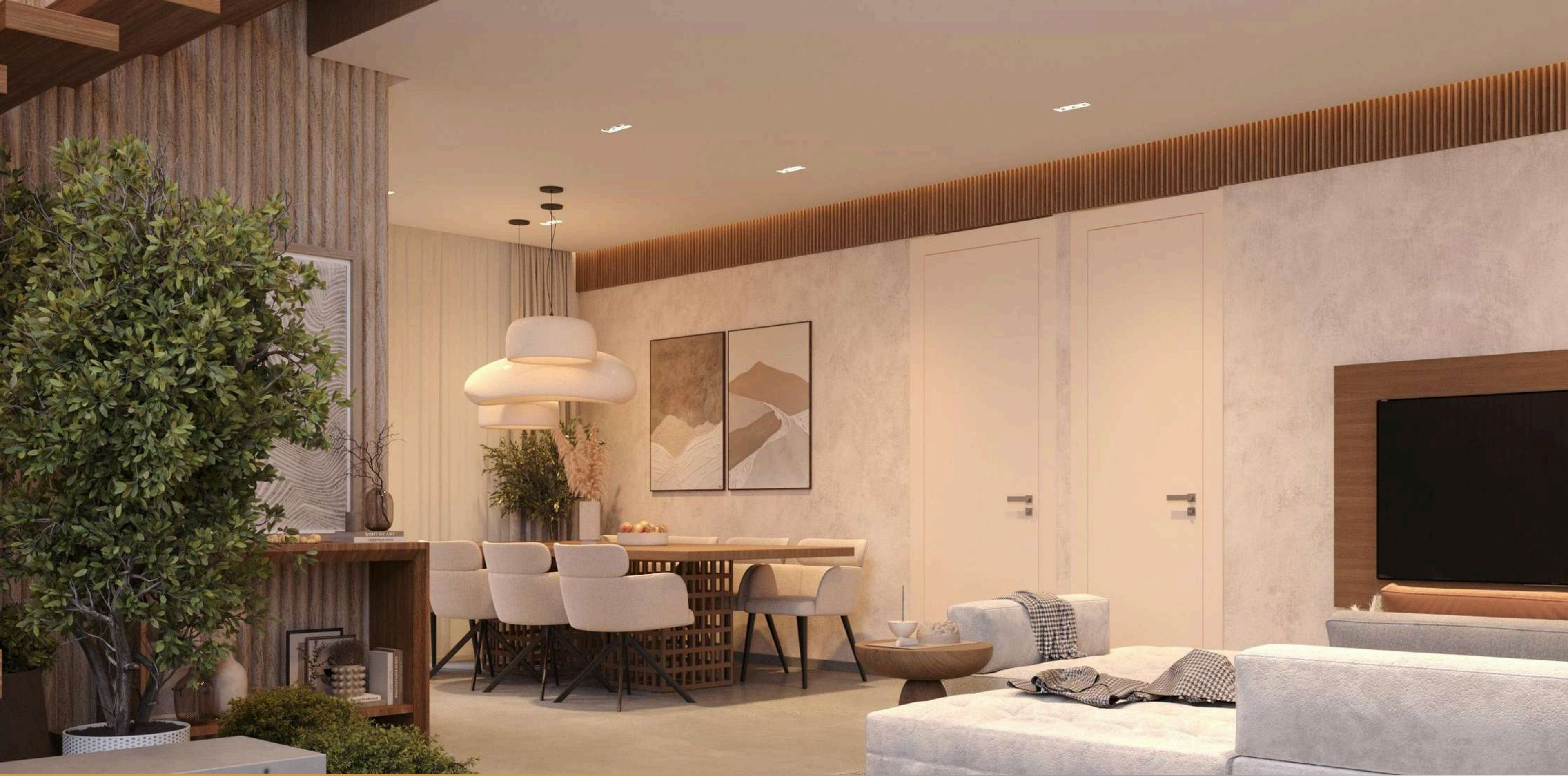
HALL DE ENTRADA