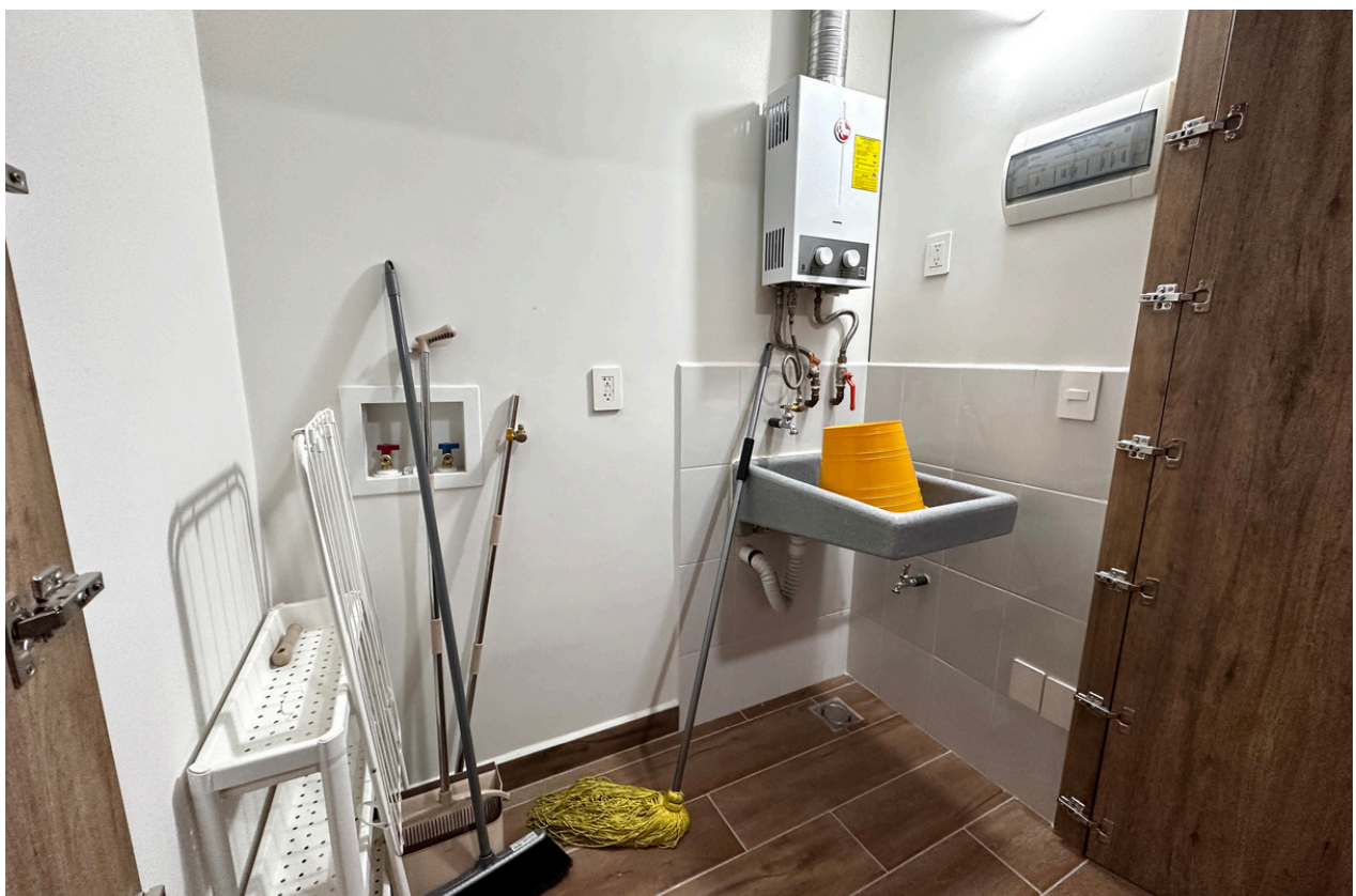
ÁREA DE LAVADO