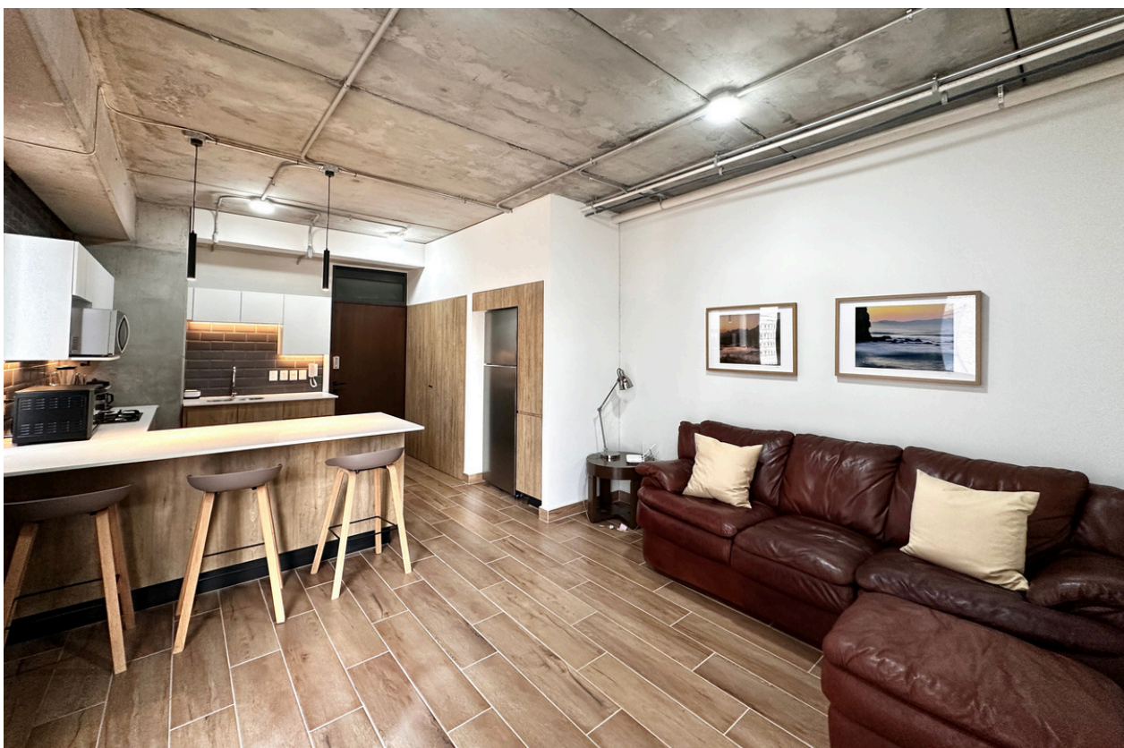
SALA - COMEDOR