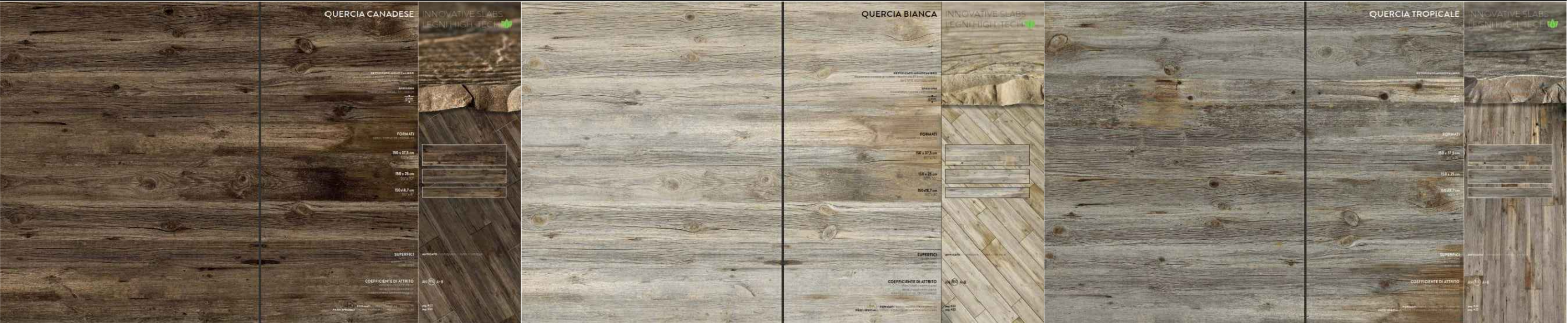
QUERCIA TROPICALE+PIETRA DI RAGUSA

Ventaja: Combinación de porcelanato tipo piedra natural y duela de porceanato tipo madera natural, para generar un ambiente de confort y fresca, con una imagen con clase.