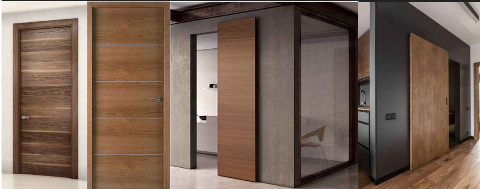
PUERTAS INTERCOMUNICACION INTERNAS