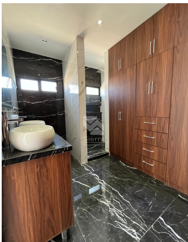
BAÑO RECÁMARA PRINCIPAL