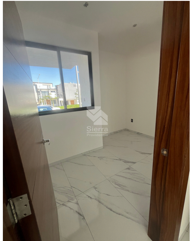
RECÁMARA - ESTUDIO P.B.