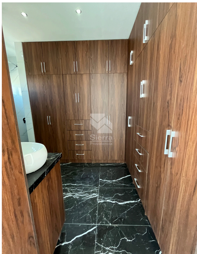
VESTIDOR RECÁMARA PRINCIPAL