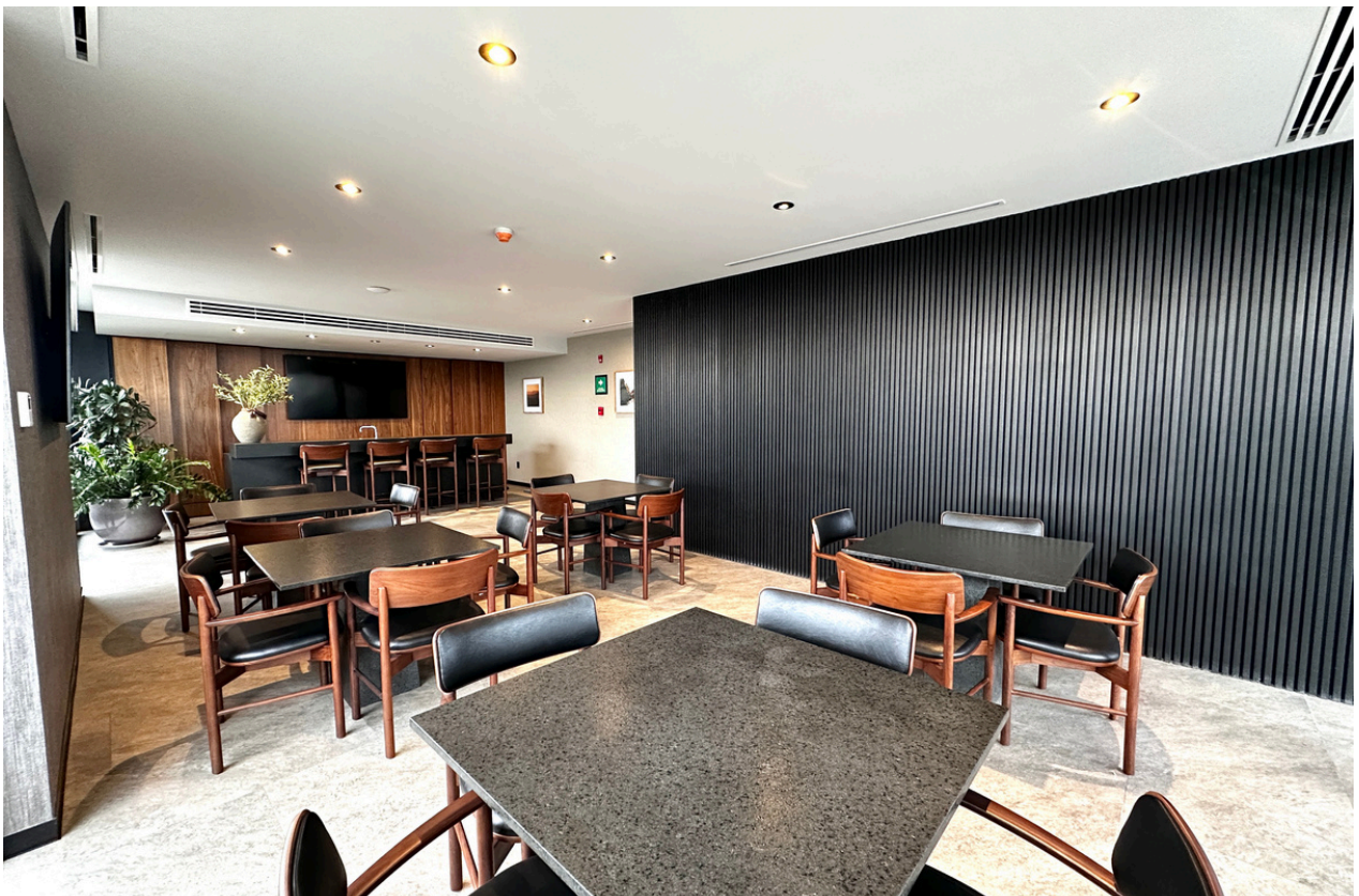
BAR - SALON DE USOS MULTIPLES