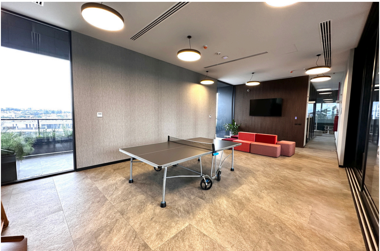
SALON DE JUEGOS