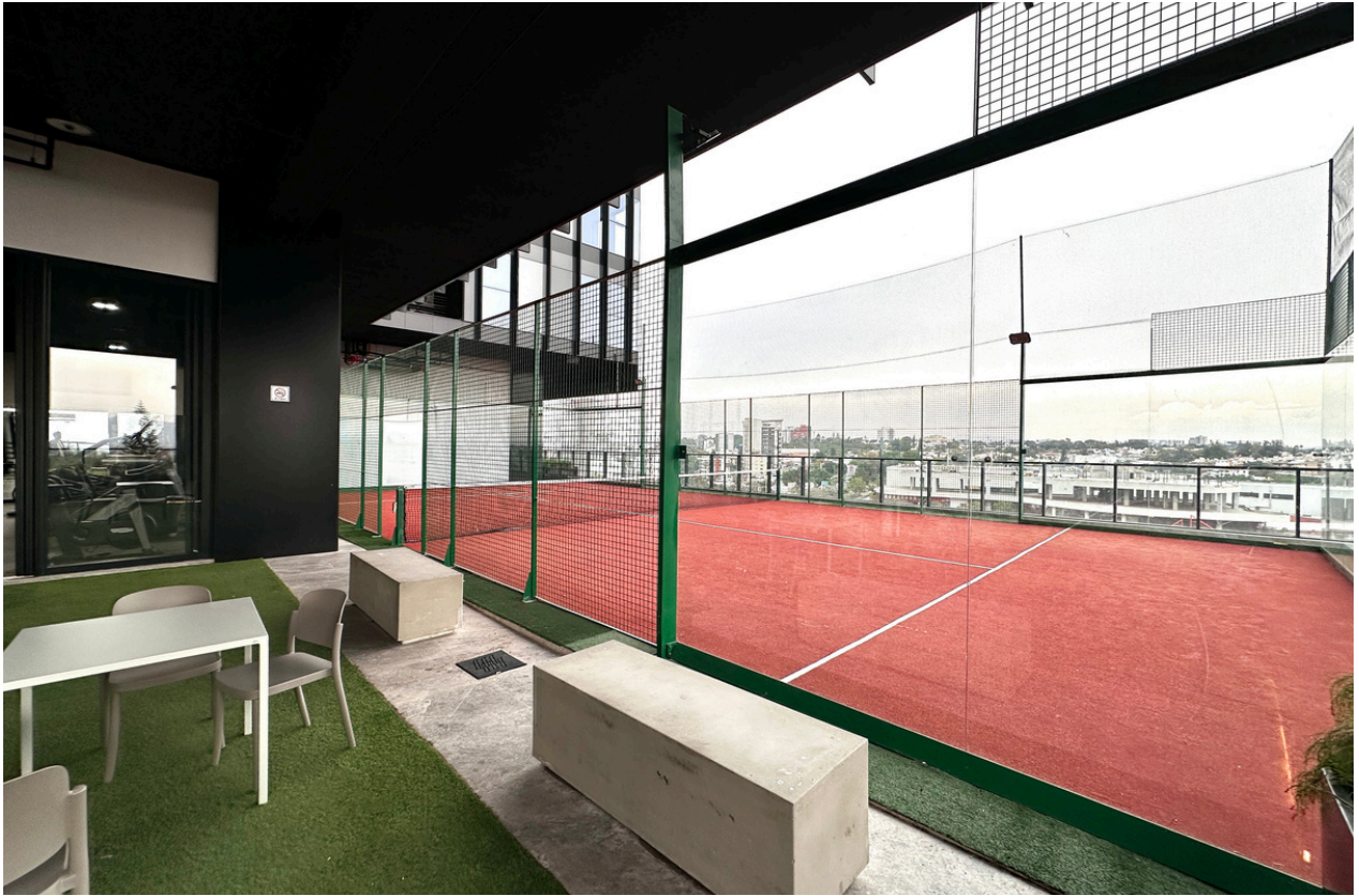
CANCHA DE PADEL