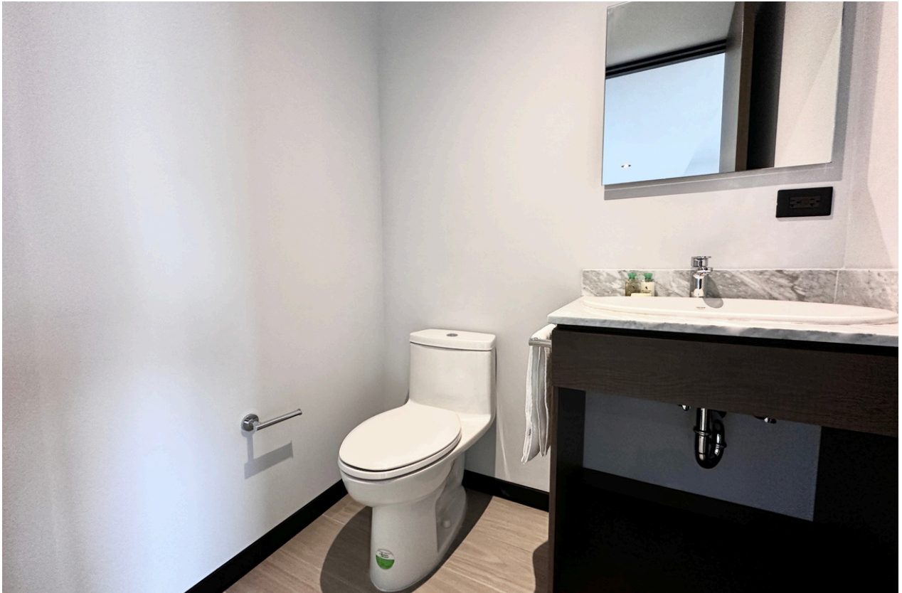
MEDIO BAÑO DE VISITAS