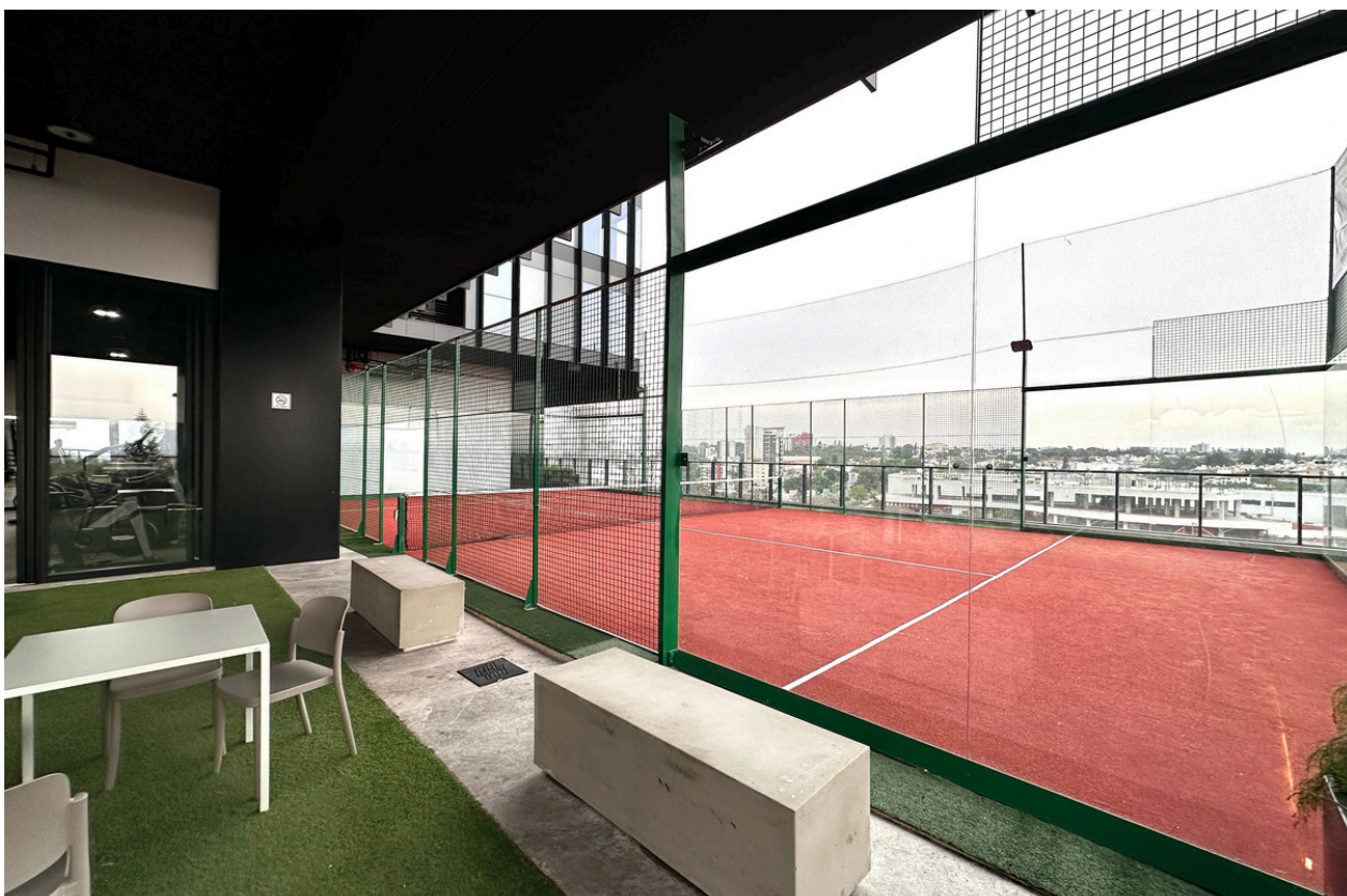
CANCHA DE PADEL