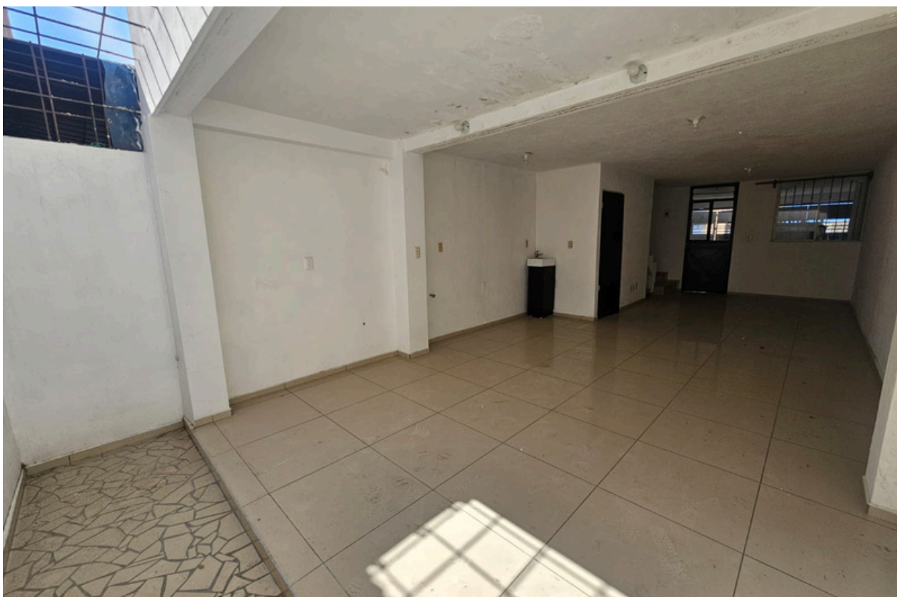
ESPACIO DE COCINA - SALA - COMEDOR