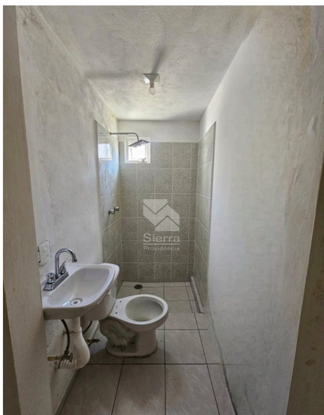
BAÑO RECÁMARA SECUNDARIA