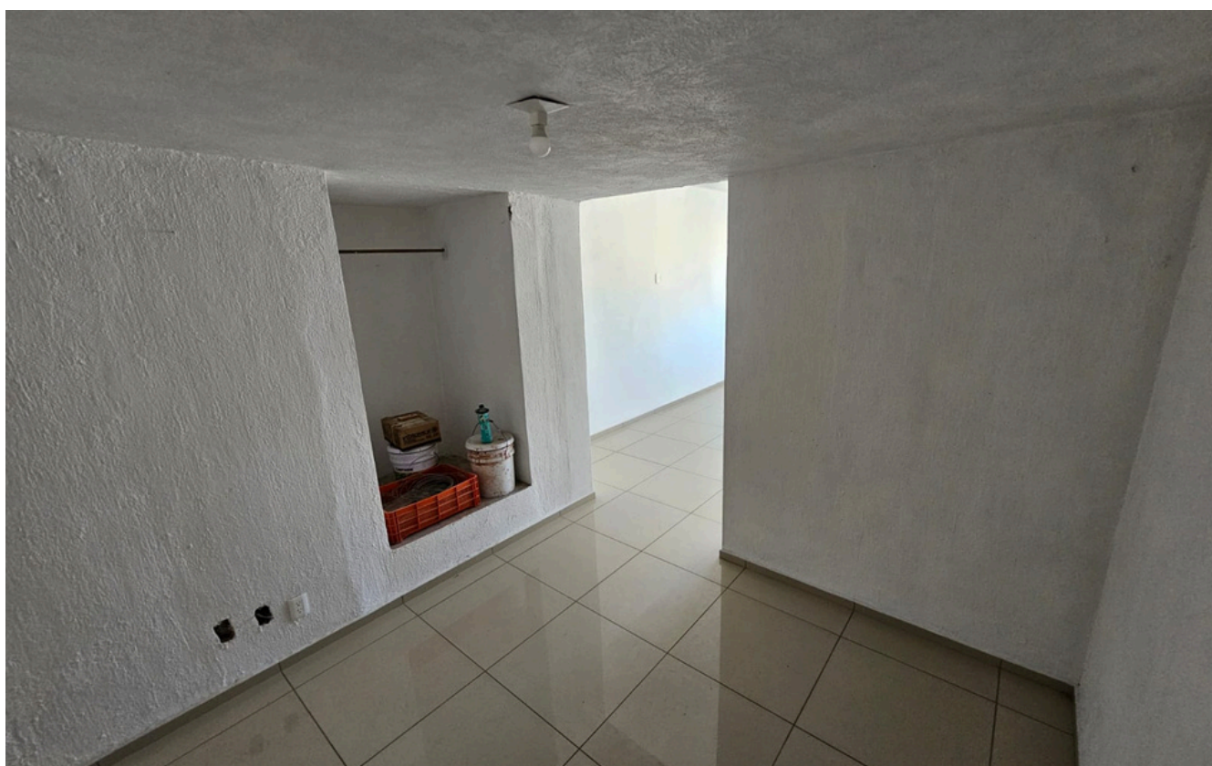
ESTAR DE TV O VESTIDOR RECÁMARA PRINCIPAL