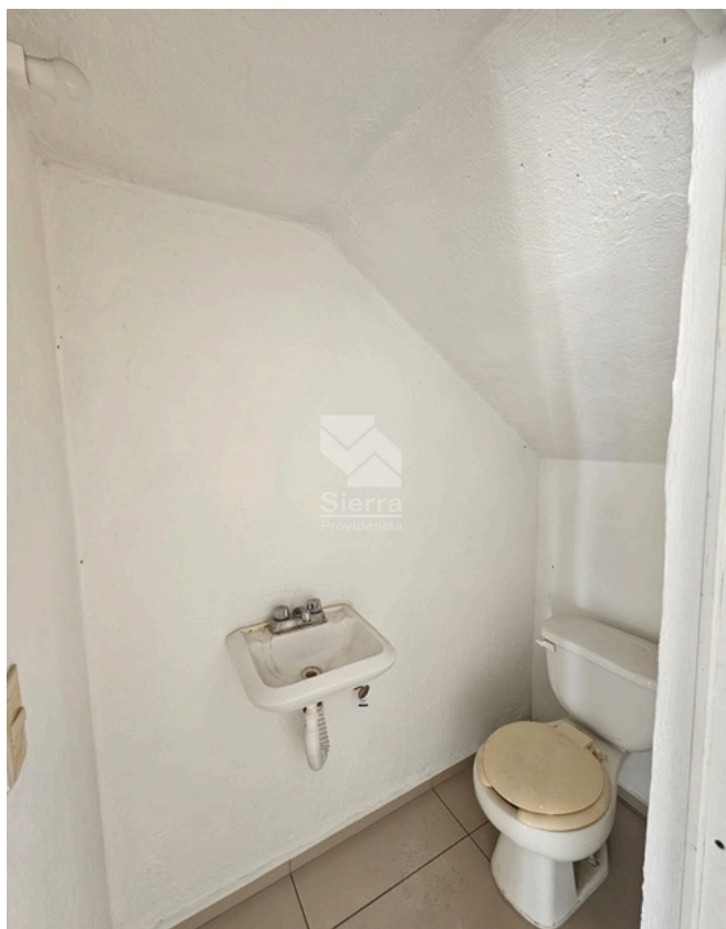
MEDIO BAÑO P.B.