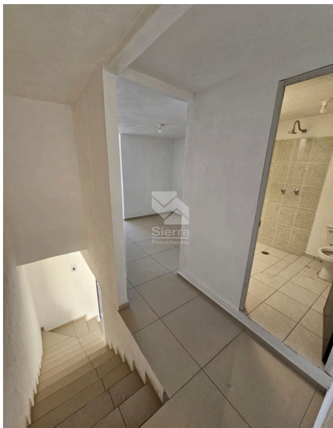
DISTRIBUCIÓN SEGUNDO NIVEL