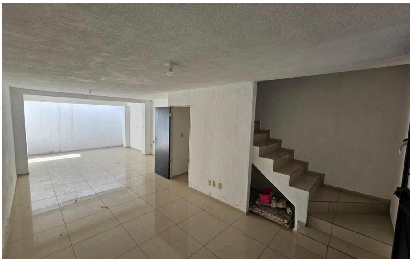
DISTRIBUCIÓN PLANTA BAJA