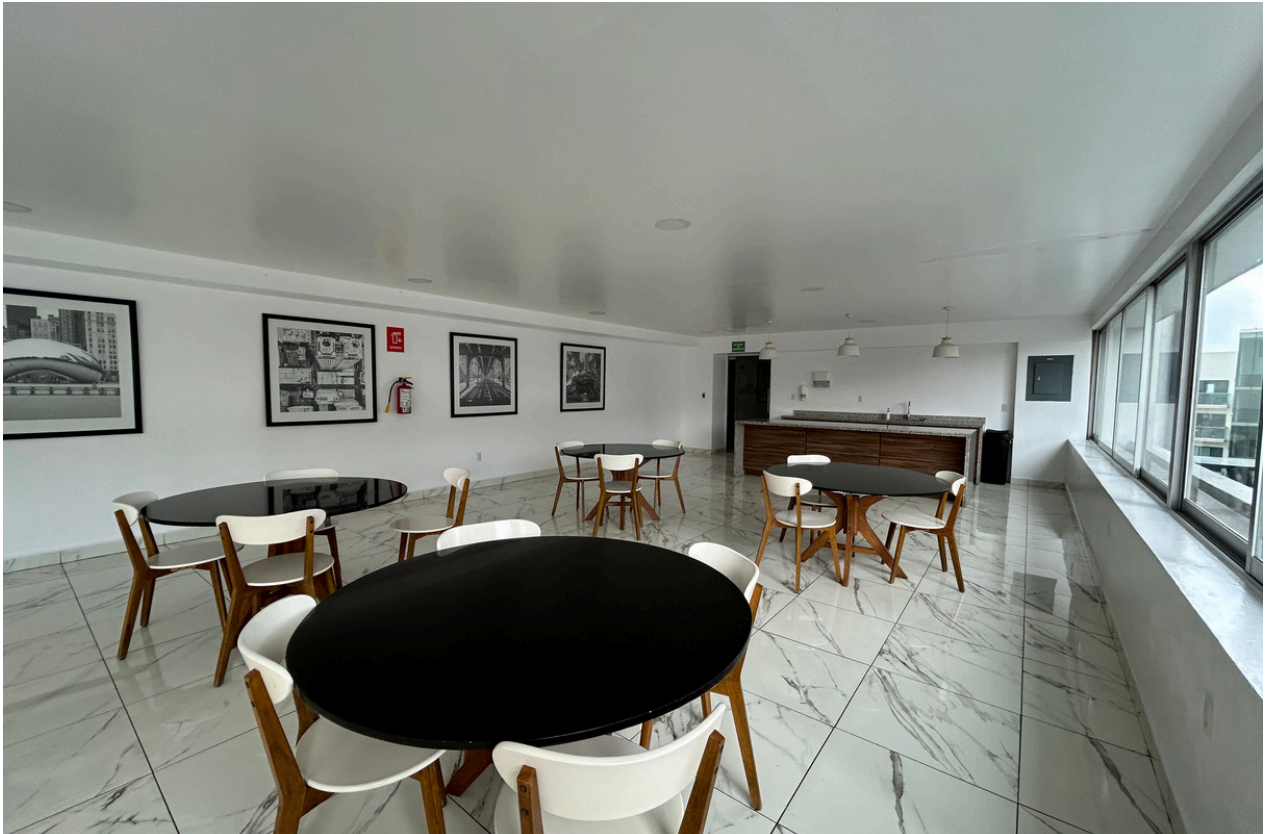
SALON DE EVENTOS