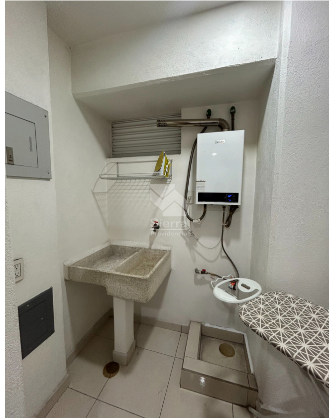
CUARTO DE LAVADO