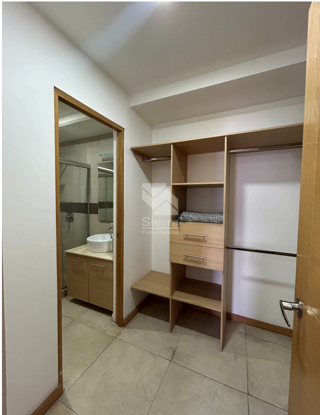
VESTIDOR RECÁMARA PRINCIPAL