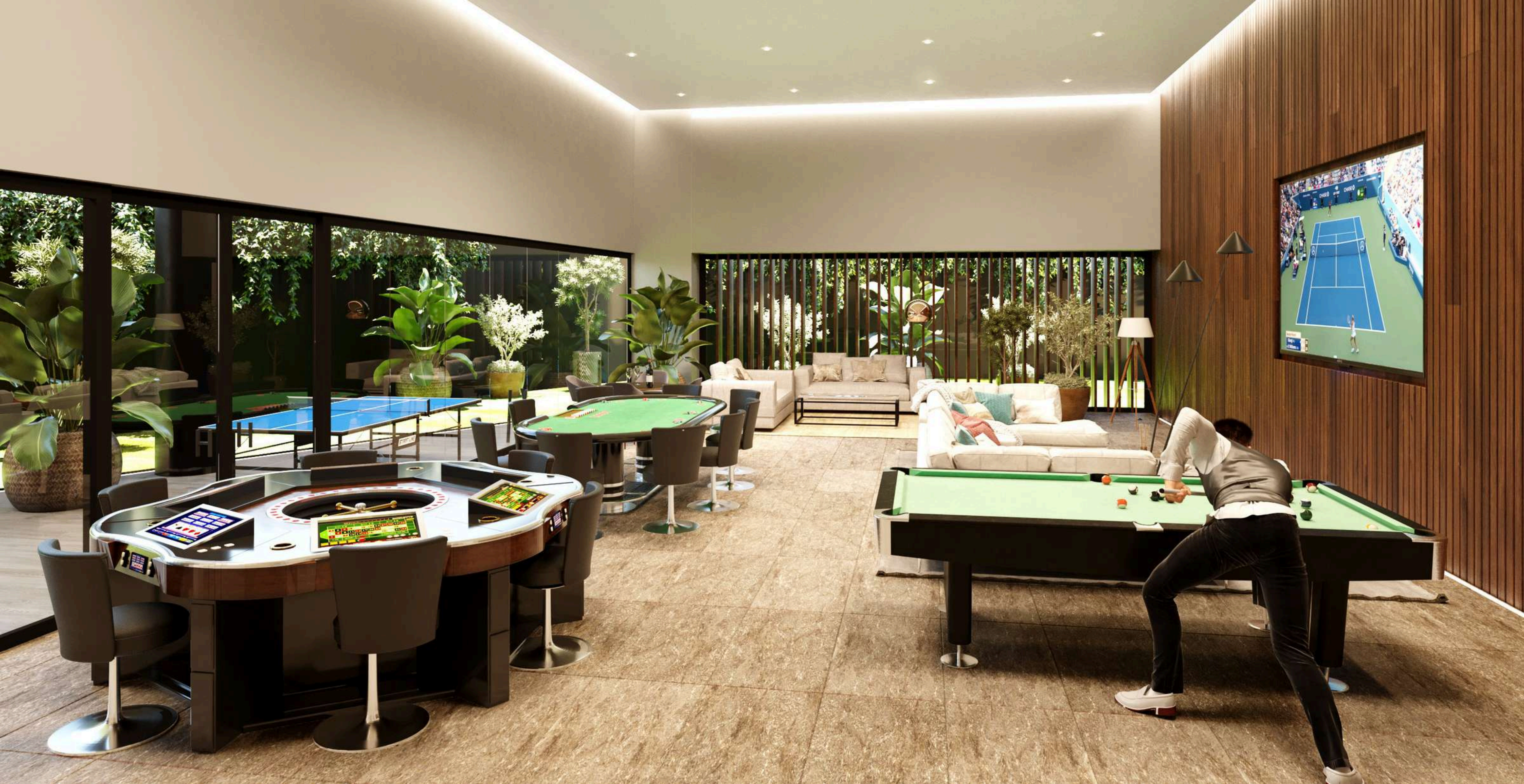
SALÓN DE JOVENÉS