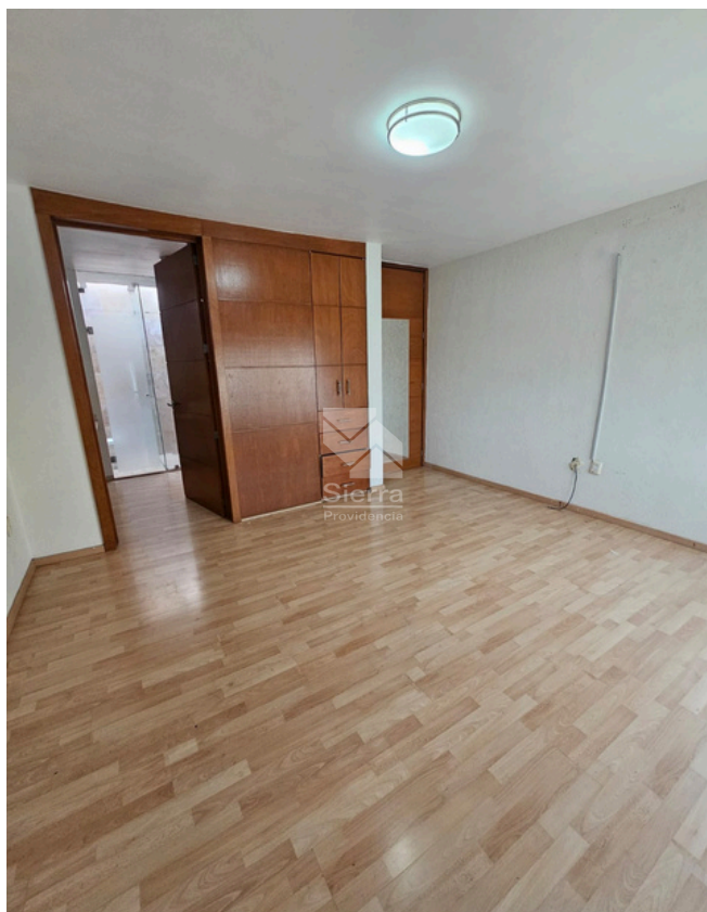
RECÁMARA SECUNDARIA 1