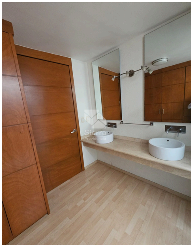
BAÑO RECÁMARA PRINCIPAL