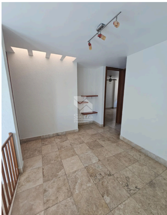
ESTAR DE TV