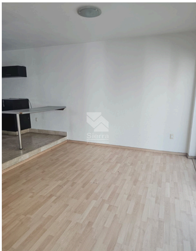
SALA - COMEDOR