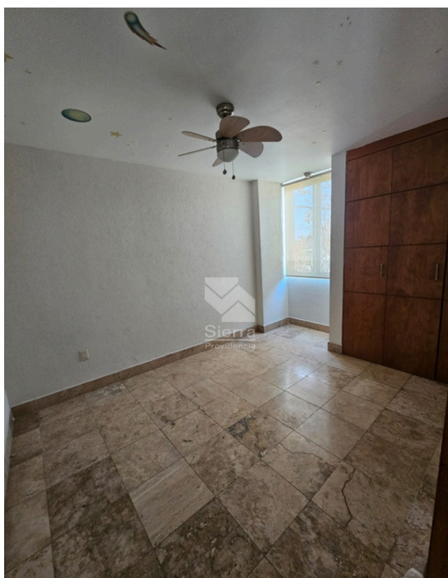
RECÁMARA SECUNDARIA 2