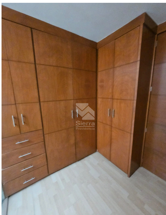
VESTIDOR RECÁMARA PRINCIPAL