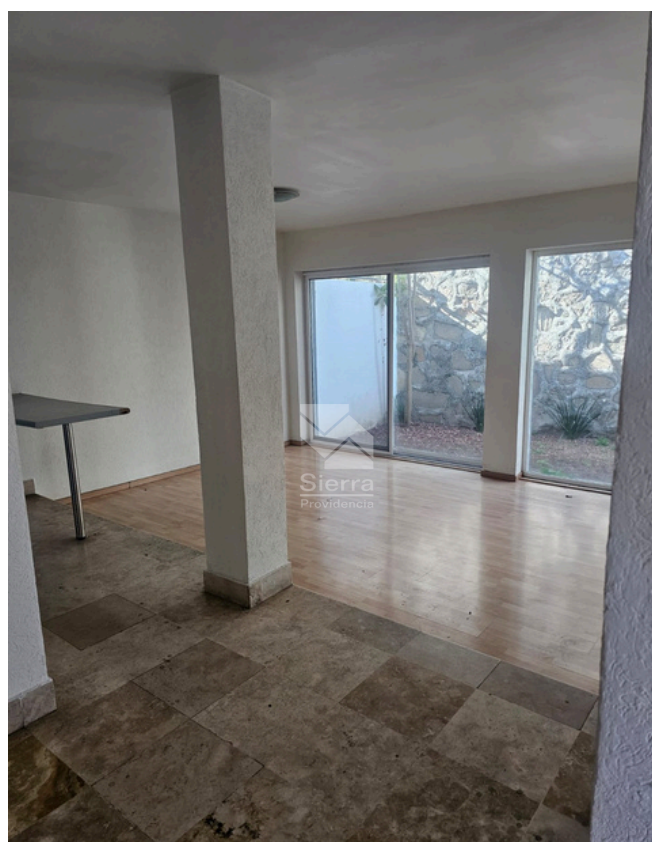
SALA - COMEDOR