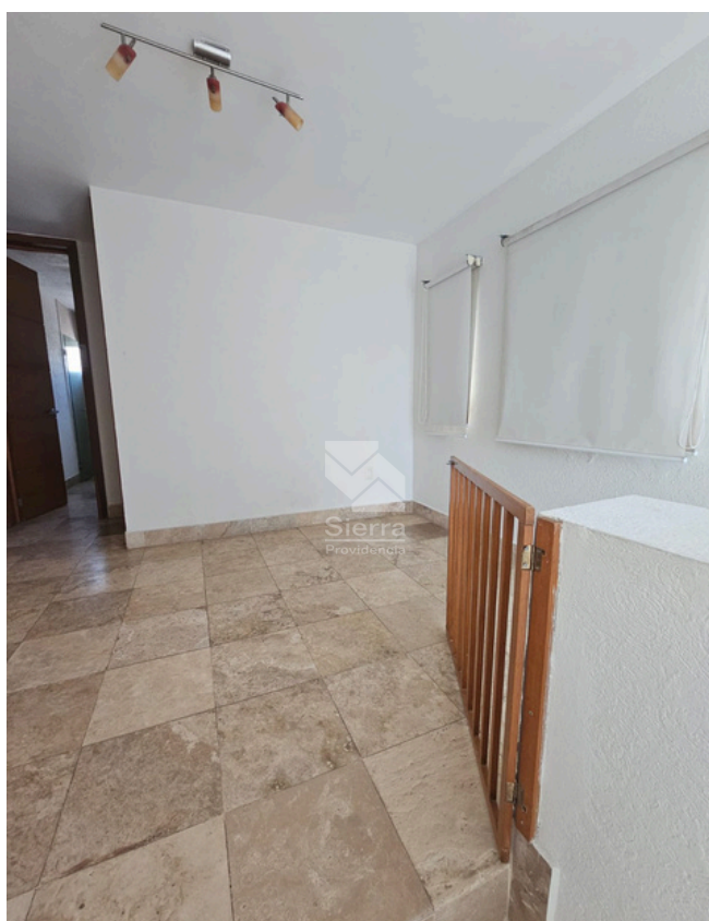
DISTRIBUCIÓN SEGUNDO NIVEL