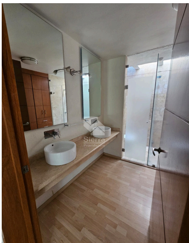
BAÑO RECÁMARA PRINCIPAL