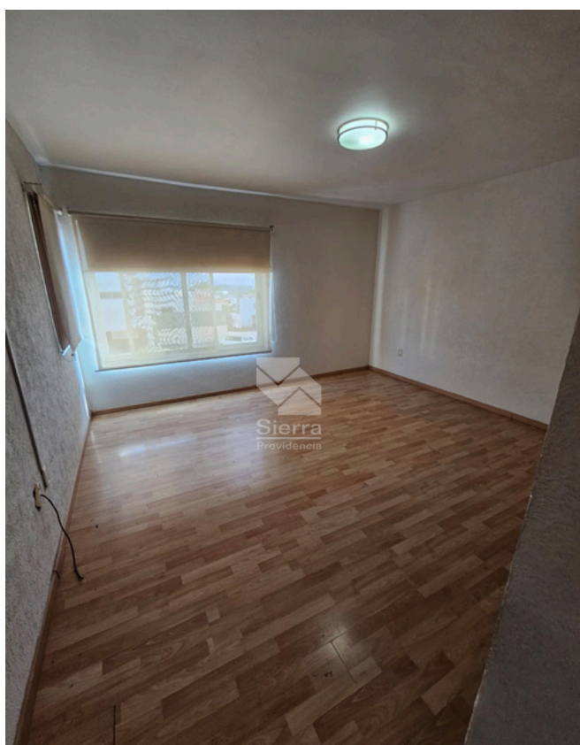
RECÁMARA SECUNDARIA 1