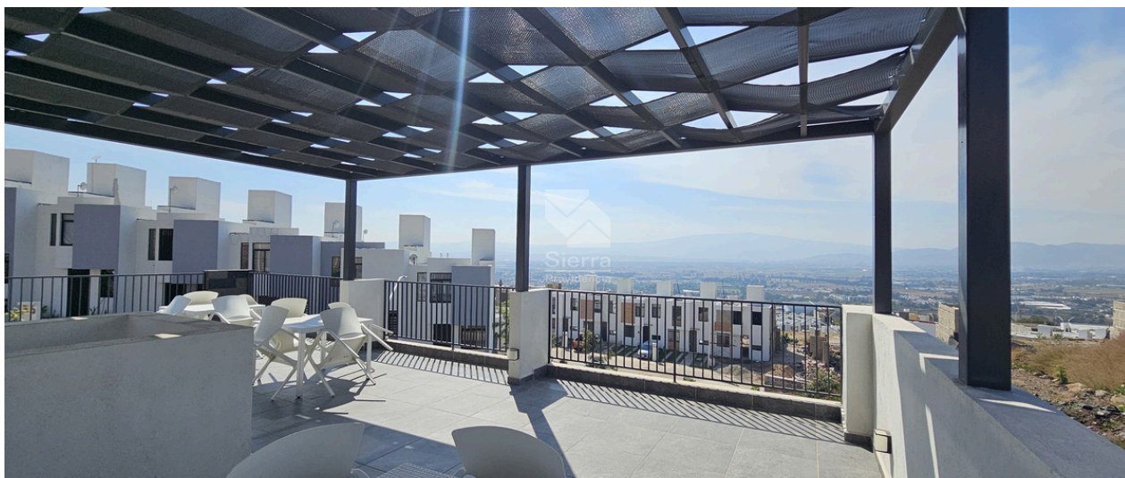
VISTA CASA CLUB