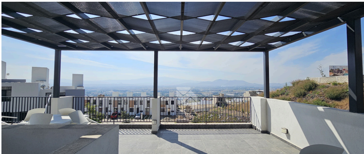
VISTA CASA CLUB