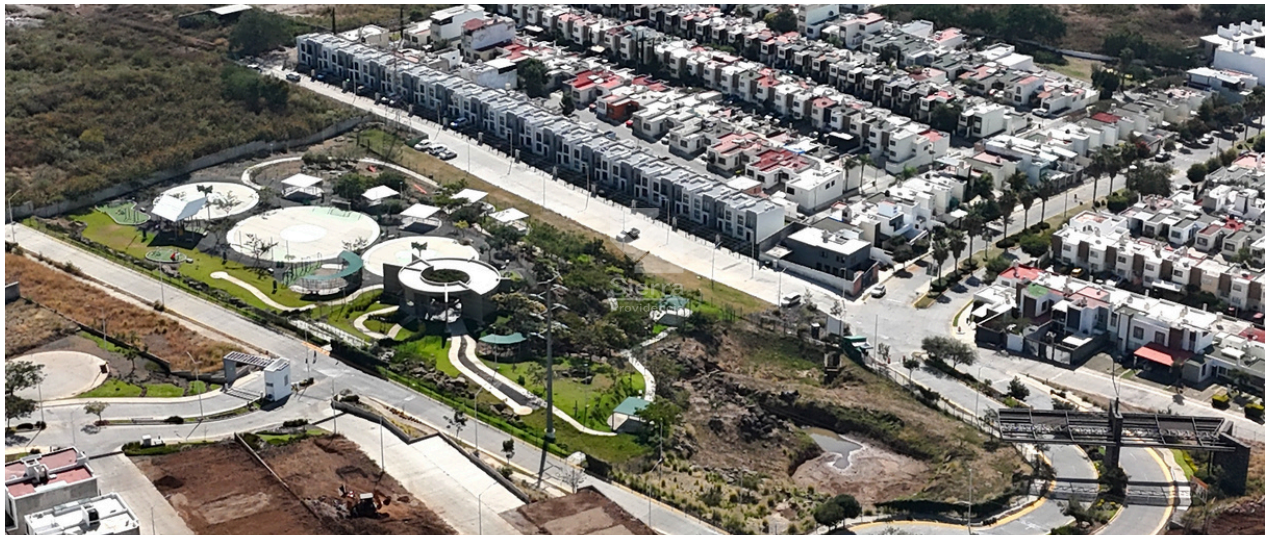
VISTA AEREA DE FRACCIONAMIENTO