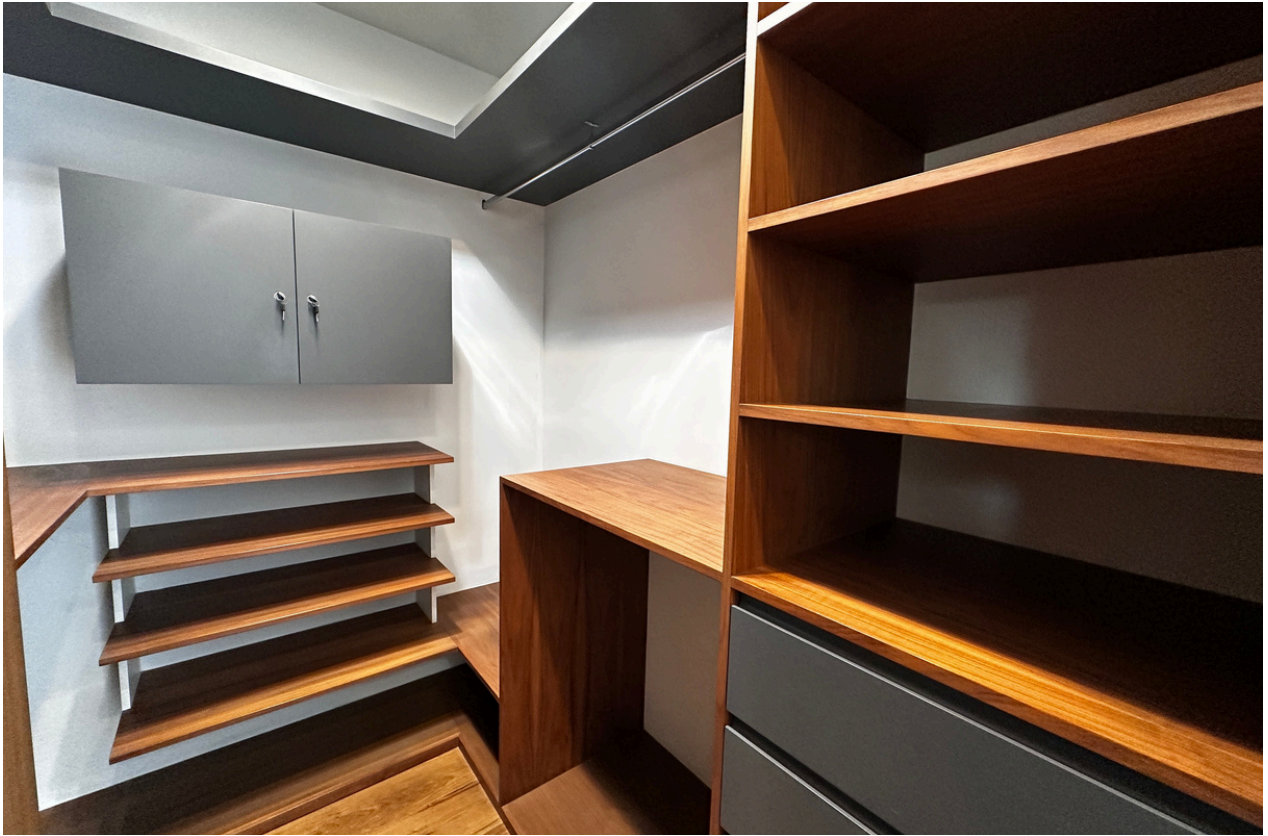
WALKING CLÓSET RECÁMARA 3