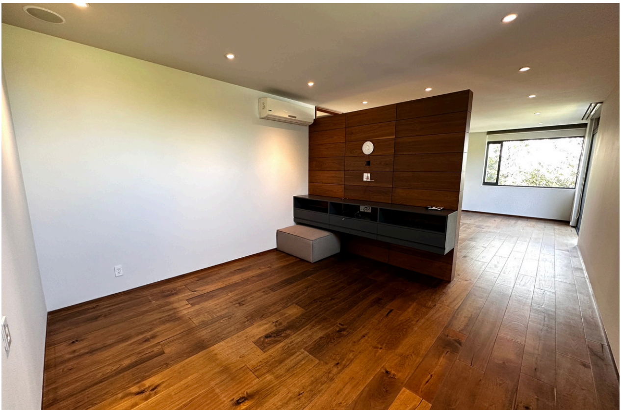
ÁREA DE ESTAR EN RECÁMARA PRINCIPAL