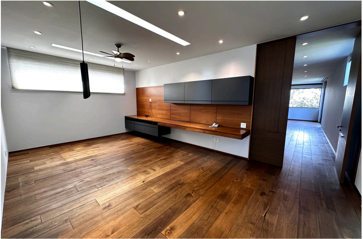
ESTAR DE TV