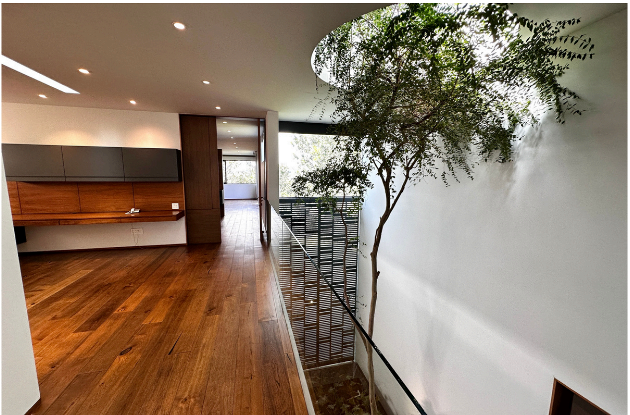
DISTRIBUIDOR PLANTA ALTA