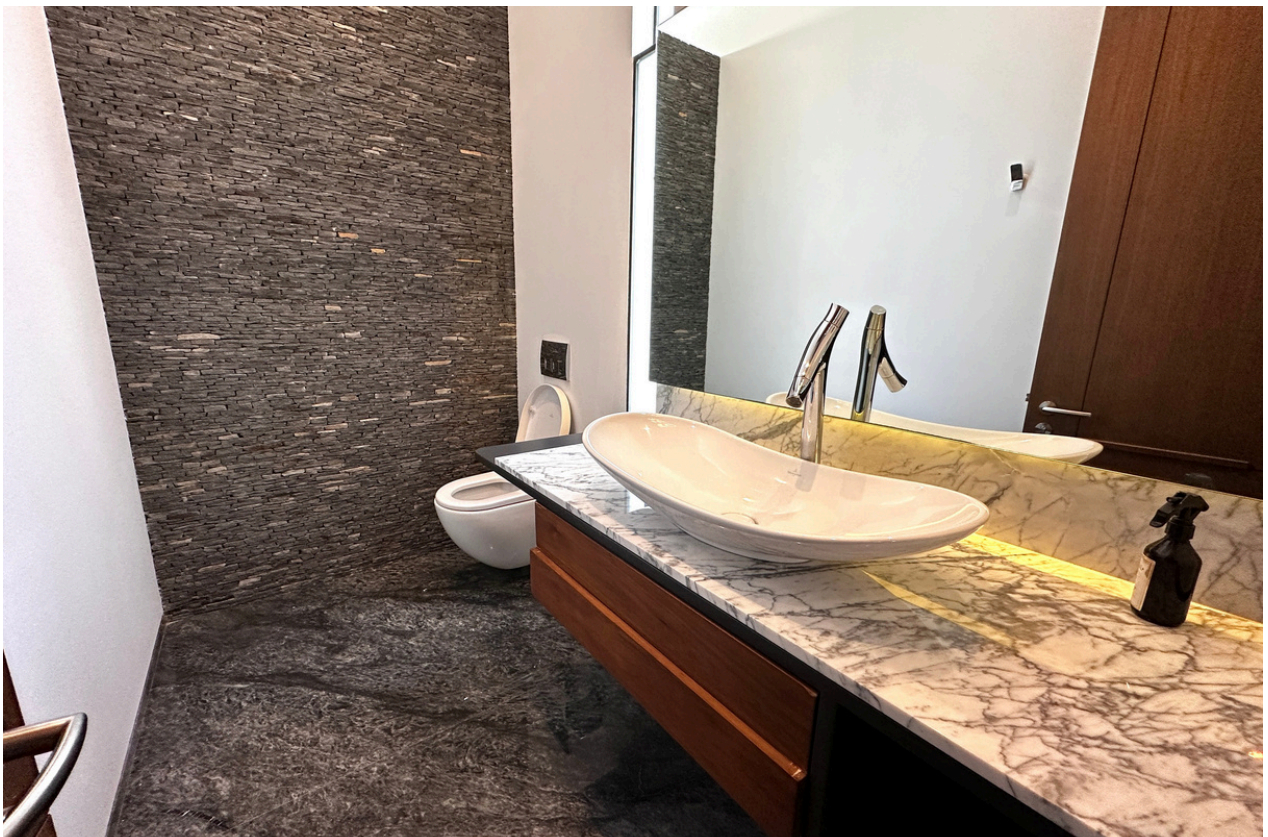
BAÑO DE VISITAS