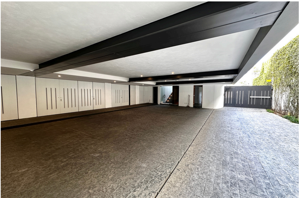
COCHERA PARA 6 AUTOS Y ÁREA DE BODEGAS