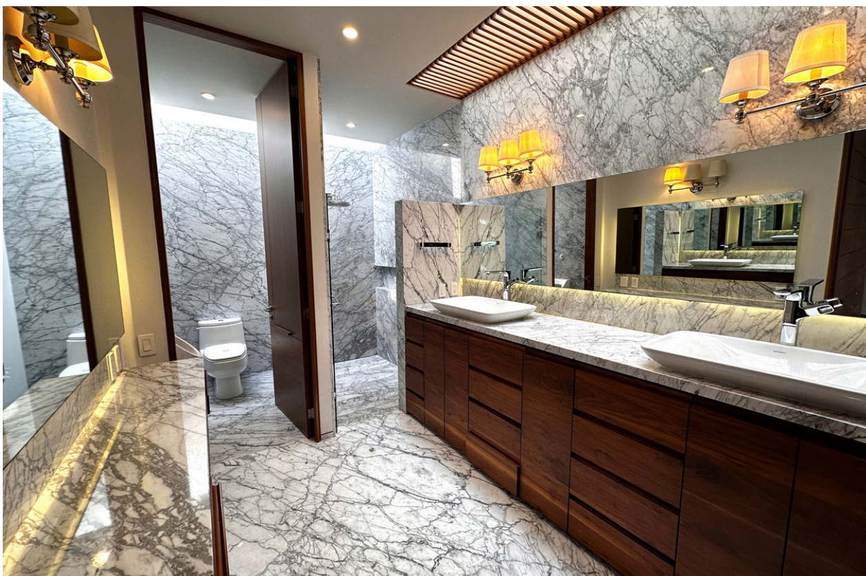
BAÑO RECÁMARA PRINCIPAL