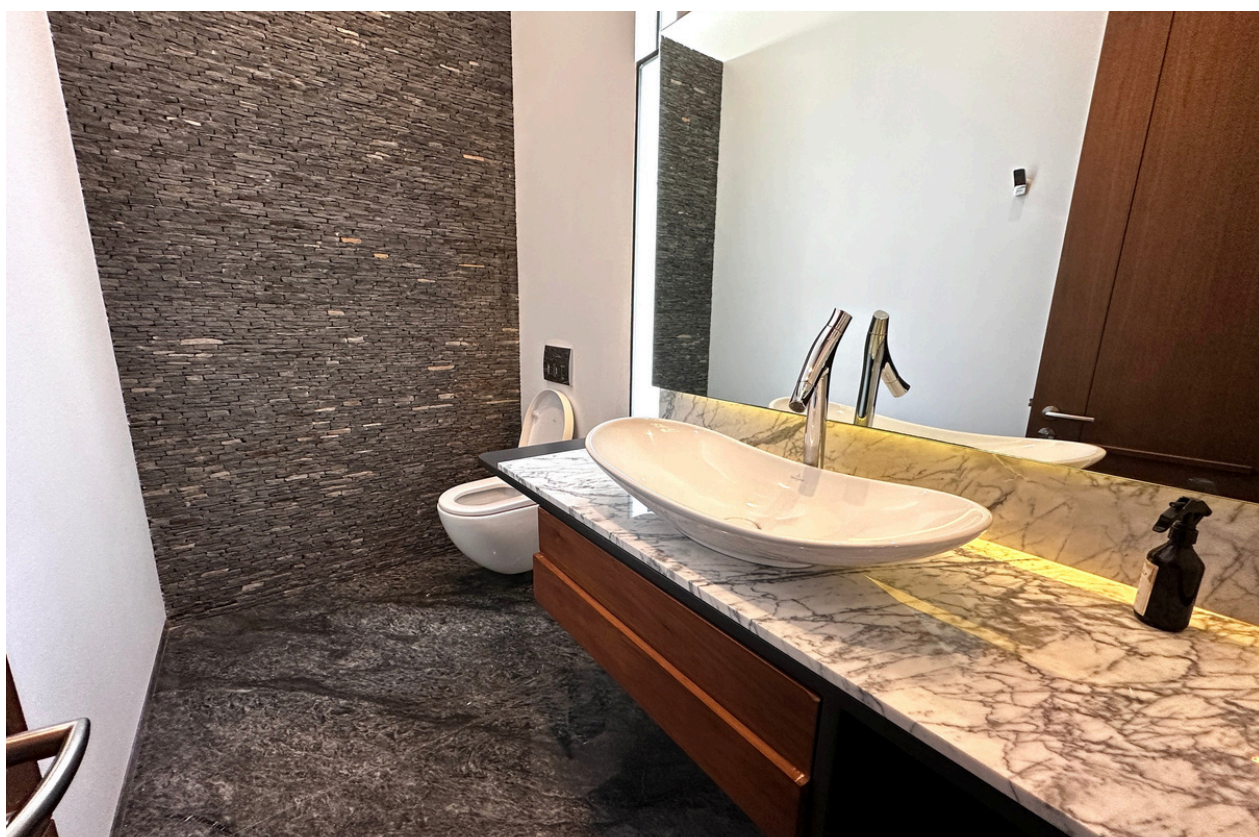
BAÑO DE VISITAS