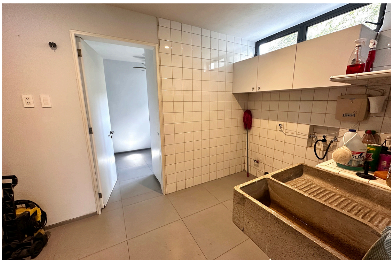
ÁREA DE LAVADO