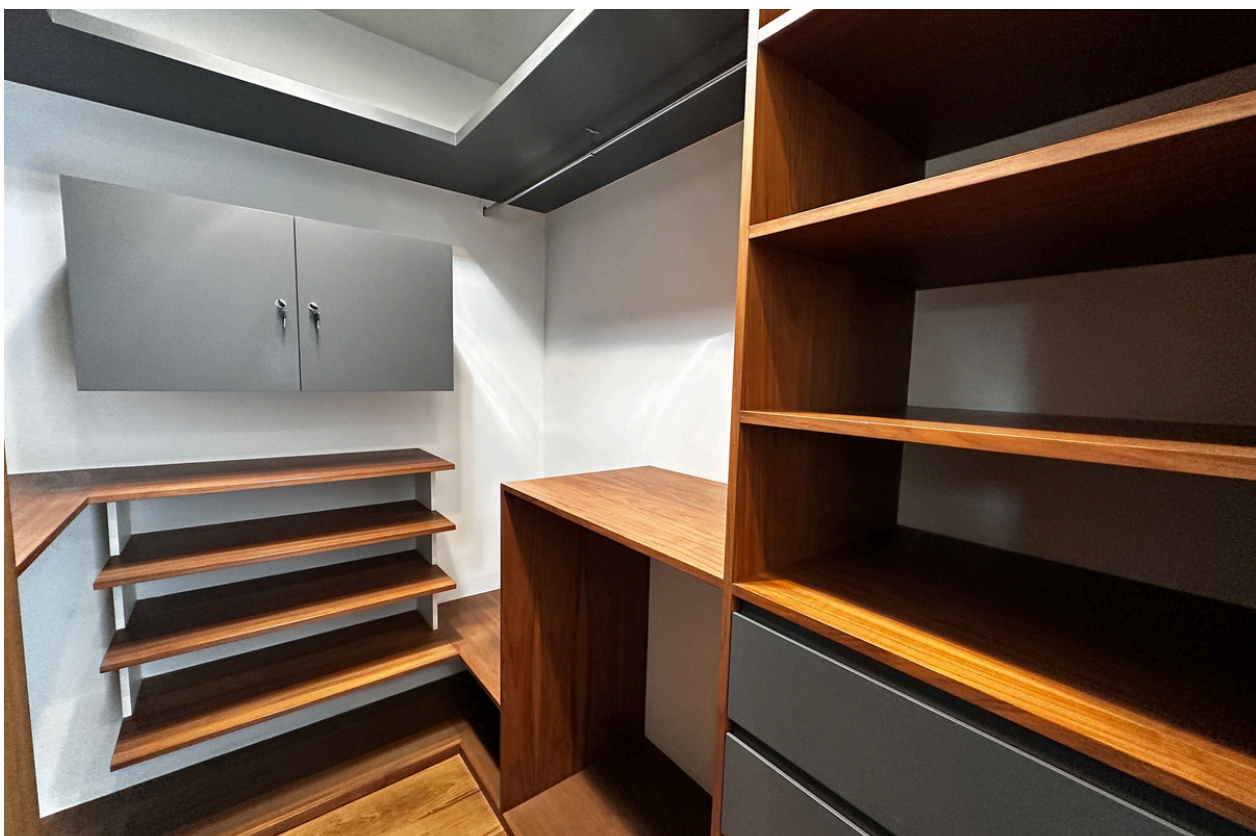
WALKING CLÓSET RECÁMARA 3