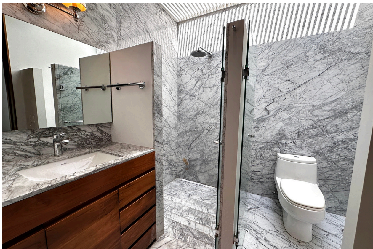
BAÑO RECÁMARA 2