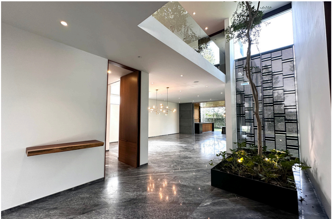
DISTRIBUIDOR PLANTA BAJA