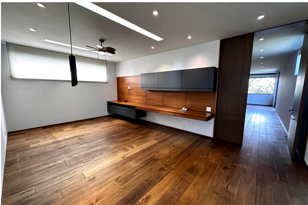
ESTAR DE TV