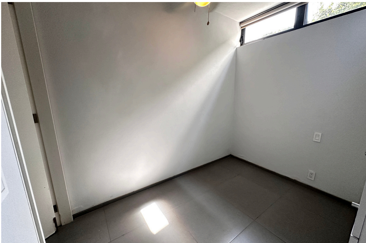
CUARTO DE SERVICIO