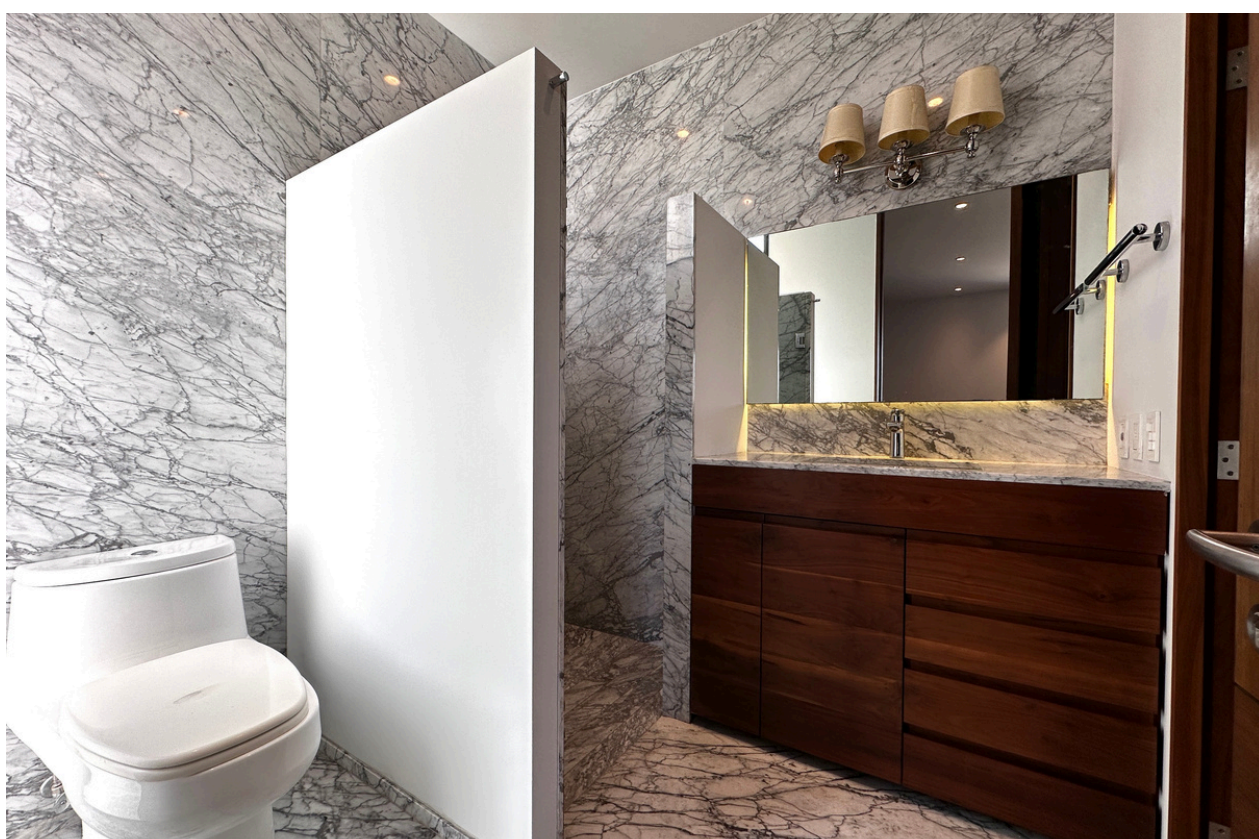
BAÑO RECÁMARA 3