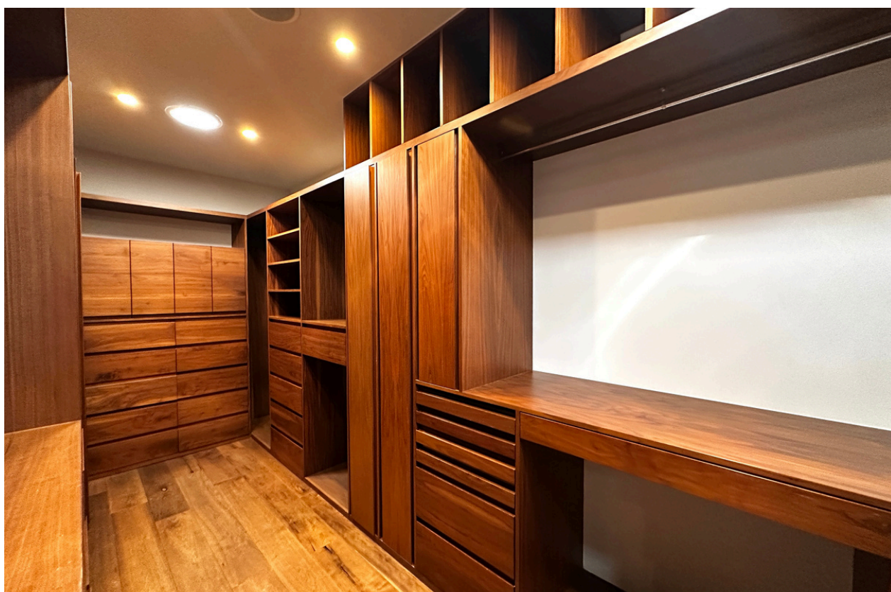
WALKING CLÓSET RECÁMARA PRINCIPAL