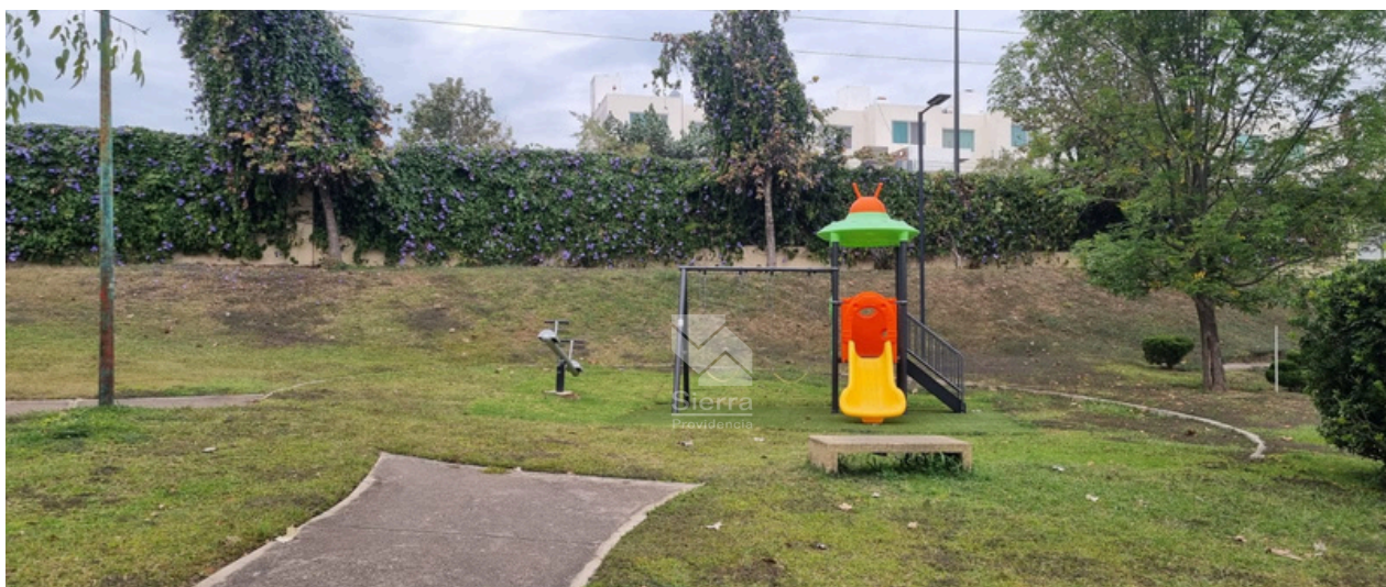
ÁREAS DE JUEGOS INFANTILES