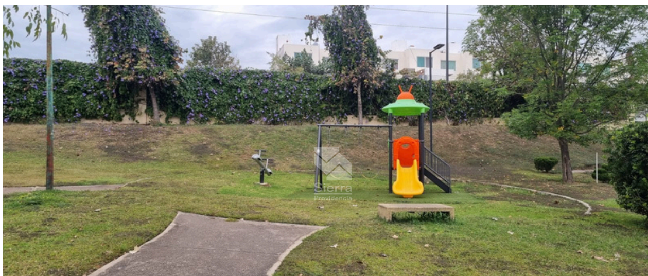
ÁREAS DE JUEGOS INFANTILES