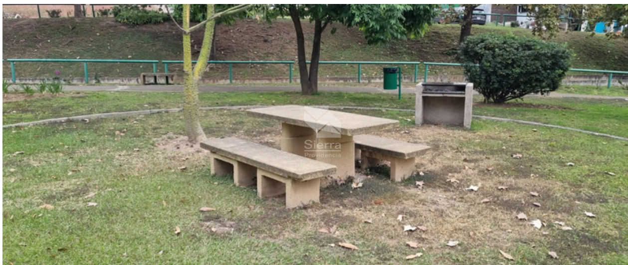
ÁREA DE ASADORES