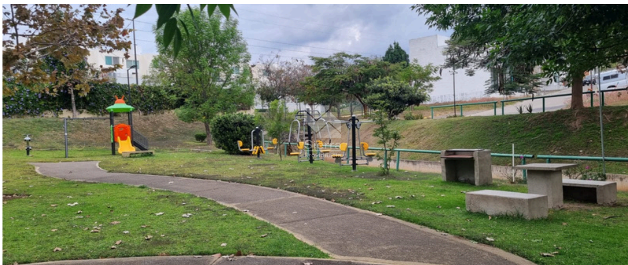
ÁREAS DE JUEGOS INFANTILES