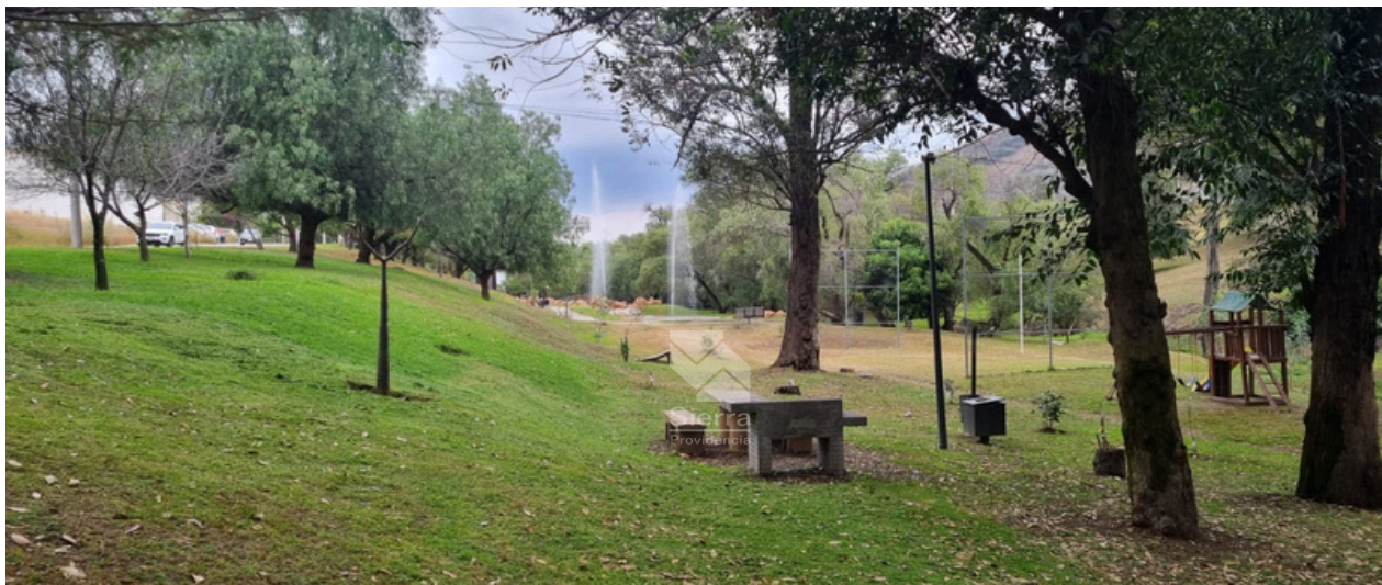
ÁREA DE ASADORES