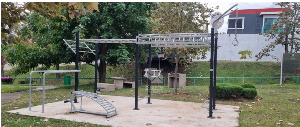
ÁREA DE EJERCICIOS