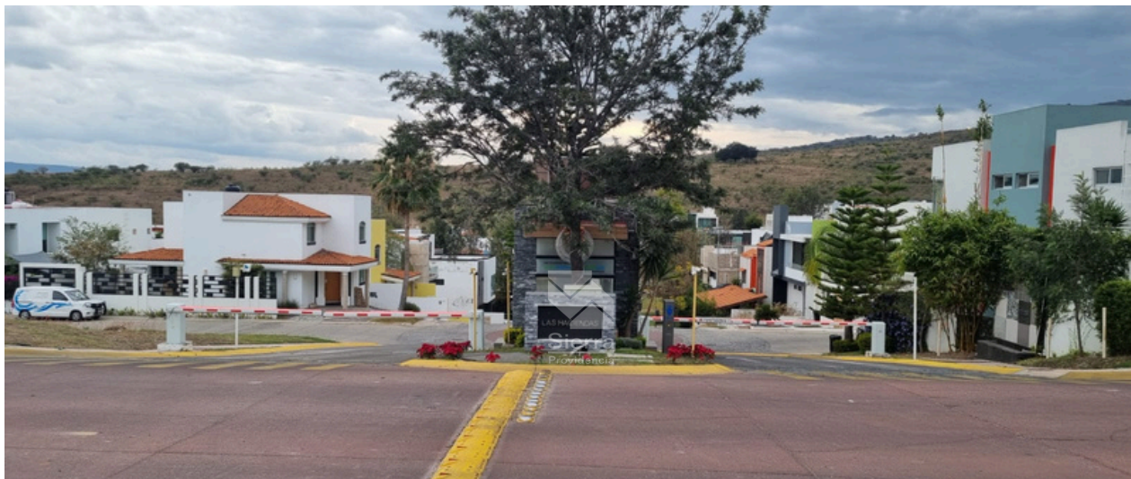
INGRESO A FRACCIONAMIENTO