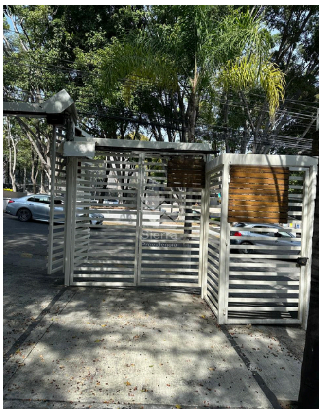
INGRESO A DEPARTAMENTO