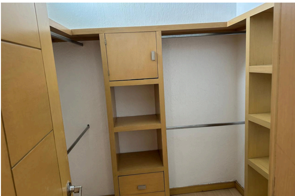
WALKING CLÓSET RECÁMARA PRINCIPAL