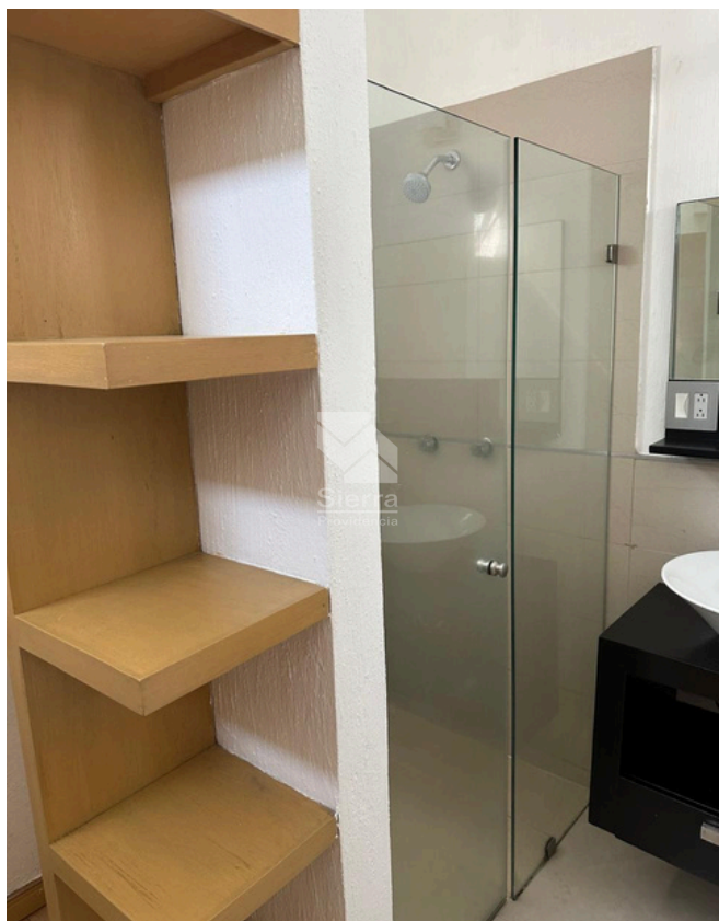
BAÑO RECÁMARA PRINCIPAL