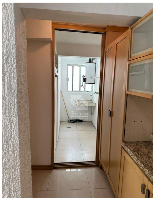
ÁREA DE LAVADO