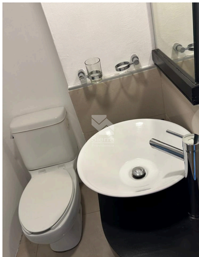
BAÑO RECÁMARA PRINCIPAL